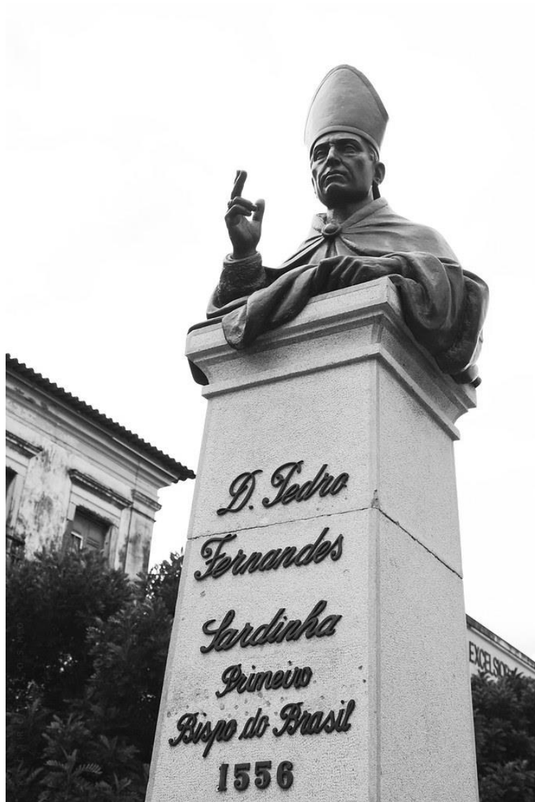
Estatua do bispo Dom Pedro Fernandes Sardinha em Salvador.