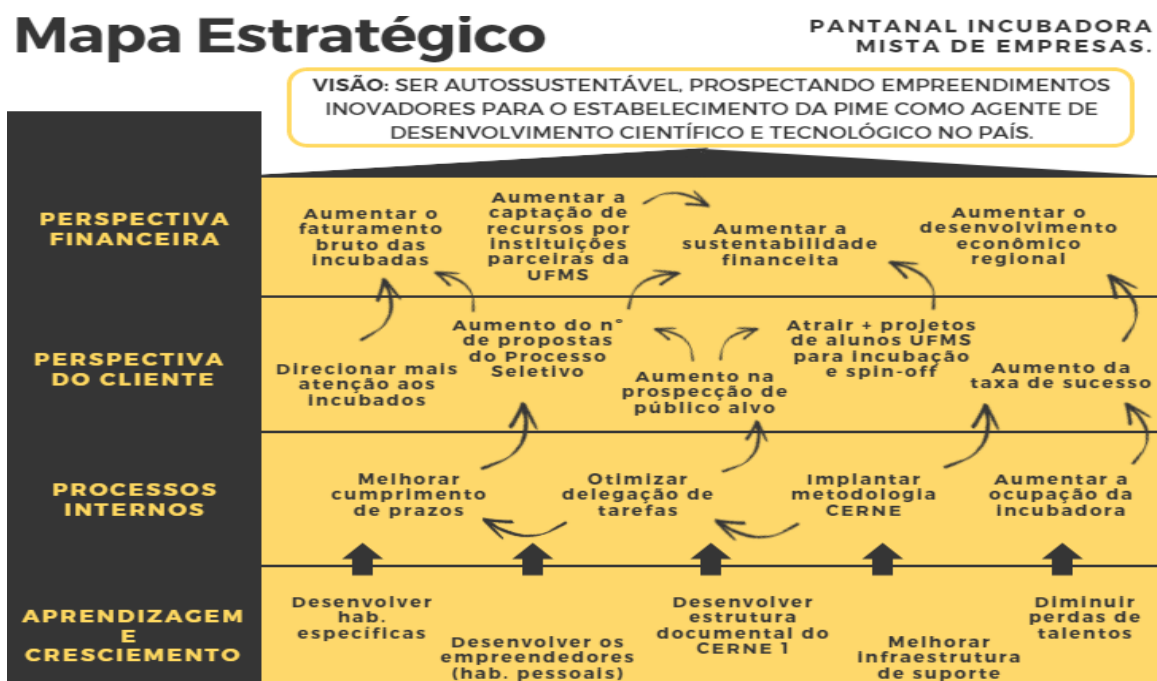
FIGURA 3 – Mapa Estratégico da Incubadora.

O mapa estratégico é a estruturação do BSC em sua totalidade. Nele é possível conferir de forma sintetizada como a empresa pretende se movimentar e o que ela pretende mudar. O mapa estratégico da Incubadora é apresentado na Figura 3.