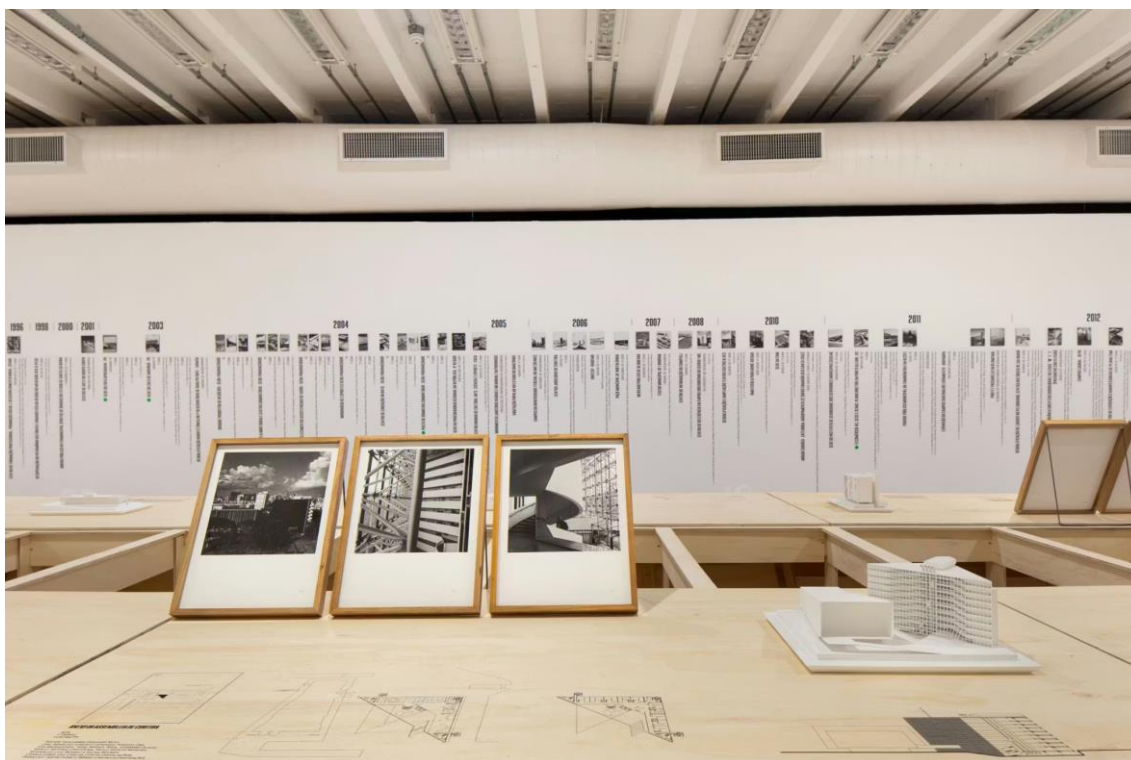
Imagem 2: Assembleia Legislativa do Paraná na mesa central Ao fundo, a linha do tempo com os projetos levantados na pesquisa.

O trajeto era concluído com a projeção de um documentário na parede oposta à entrada, funcionando como um ponto de fuga visual da exposição. Que reunia depoimentos, projetos e obras de nomes fundamentais da arquitetura e urbanismo locais, enriquecido pelas análises teóricas da curadora da exposição e dos pesquisadores Key Imaguire Junior, Paulo Pacheco, Thais Saboia e Fábio Domingos Batista.