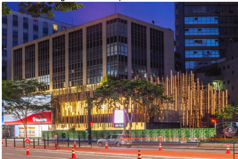
Figura 02: Prédio Japan House São Paulo

Ademais destaca-se a programação cultural, que trazem em suas exposições um novo olhar da arte e produção japonesa. Esse centro cultural tem como objetivo transmitir a cultura nipônica com a exploração do Japão contemporâneo em diversos aspectos para o mundo. No Brasil, a JHSP apresenta programações efêmeras que atravessam as áreas da tecnologia, moda, arte, design, gastronomia, arquitetura e a mescla com a tradição de forma não convencional.