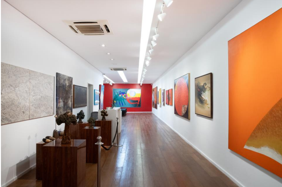
Figura 03: A realidade máxima das coisas

desafiando a percepção externa que frequentemente resume a diversidade nikkei a uma visão homogênea. Por isso, o título contrapõe “a realidade mínima das coisas” com “a realidade máxima das coisas”, refletindo uma arte expandida, sensível e perceptiva (Klintowitz, 2024).