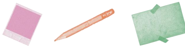
Fig. 2 - Quadro de Diretrizes Projetuais.