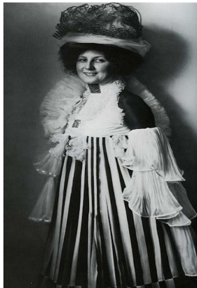
Figura 2 – Emilie Flöge em Vestido “Reforma”