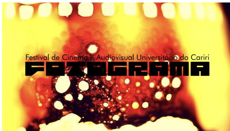
Figura 4 - Modelo de aplicação da marca nas versões digitais

As cores aparecem nessa primeira edição a partir das imagens dos filmes que participam do evento, apenas em peças digitais que serão publicadas em redes sociais e no site do festival. Os mais diversos frames que fazem parte dos filmes poderão ser extraídos e serem utilizados na comunicação nas redes sociais.