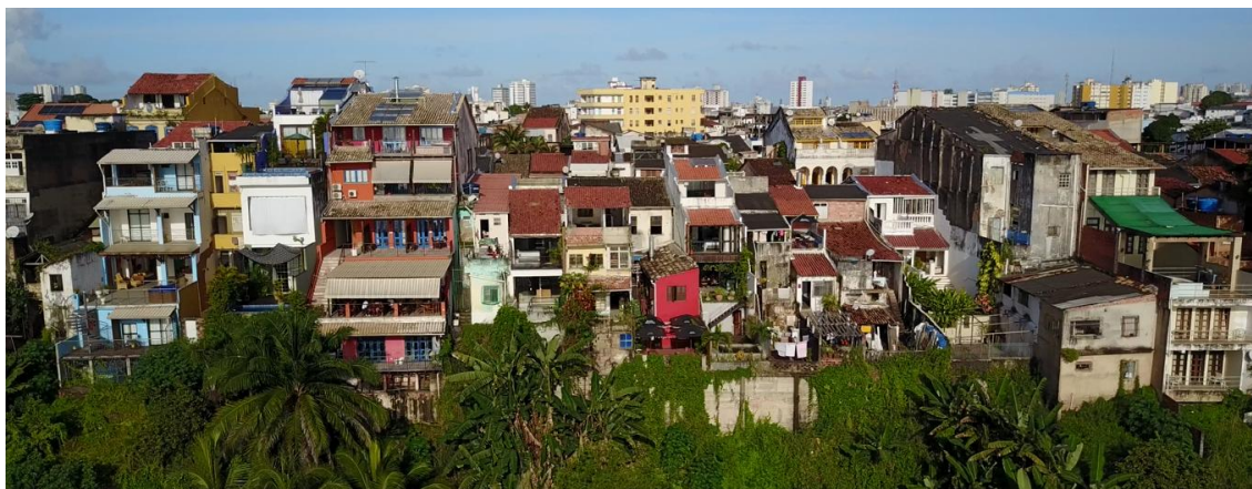
Figura 5 - Encosta do Santo Antônio evidenciando o acumulado de intervenções

Nessa imagem se evidencia o resultado do acúmulo de intervenções nos quintais, sem fiscalização, impossibilitando o reconhecimento, a partir dessa visual, como um bairro histórico.