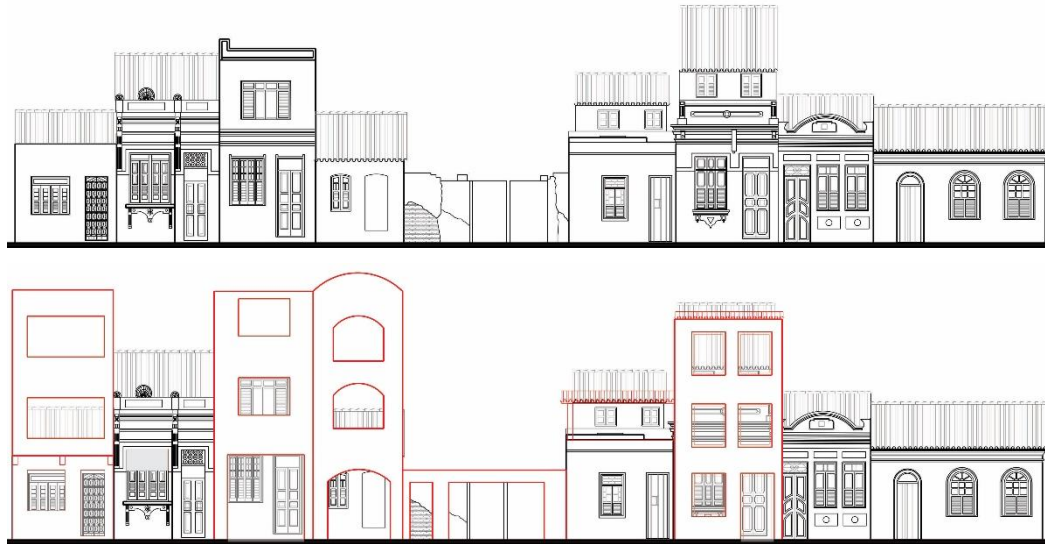
Figura 4 - Alterações na composição das fachadas da Rua dos Carvões entre 1979 e 2025

Alterações identificadas na composição de um conjunto de fachadas do bairro em estudo, no qual se destacam a manutenção ou a ruptura do ritmo, volumetria e revestimentos originais dos imóveis.