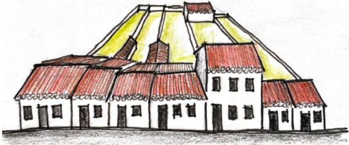
Figura 1 - Representação esquemática da tipologia predominante e reconhecida no tombamento do Santo Antônio Além do Carmo.

com coberturas cerâmicas em duas águas, inseridas em lotes estreitos e profundos, majoritariamente implantadas em “L” e com quintais posteriores (figura 1). O tombamento reconheceu essa configuração e passou a incidir sua proteção sobre ela, restringindo tudo aquilo que pudesse prejudicar a harmonia do conjunto.