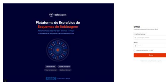
Fig. 2. Tela de login, possibilitando que tanto professor quanto aluno acessem a ferramenta.