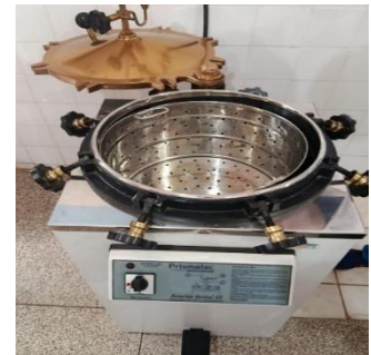
Figura 06- Autoclave