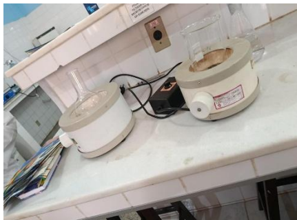
Figura 01- Manta aquecedora

Quadro 01- Equipamentos que emitem calor presentes no laboratório de biologia suas características, cuidados e usos de acordo com as referências consultadas. Campus da UEPA Conceição do Araguaia/PA