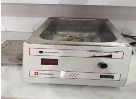
Figura 04- Banho maria

19 - 20 -21 de maio 2026 - ISSN 2358-2995