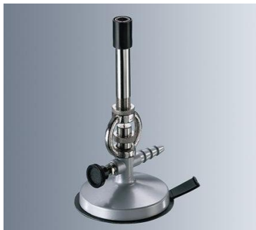
Figura 02- Bico de Bunsen aquecedora