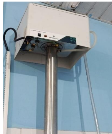
Figura 07- Destilador

É importante observar que durante as atividades didáticas no laboratório todo cuidado e a atenção são necessários, uma vez que é proibido qualquer tipo de alimento no interior do laboratório e uso de roupas inadequadas como short, saias, pois deixam a parte inferior do corpo desprotegidos. O mais adequado é o uso de calça jeans e uso de sapatos fechados, sendo o mais comum o uso de tênis por parte dos alunos.