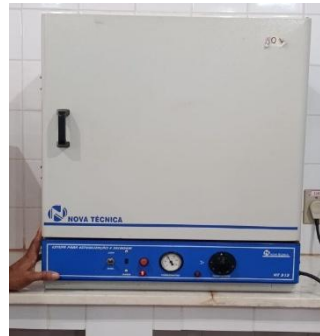
Figura 05- Estufa