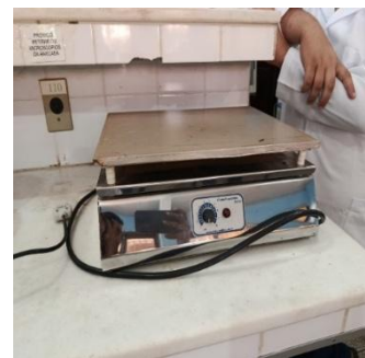
Figura 03- Chapa aquecedora