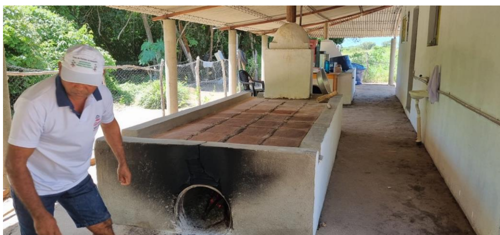
Figura 2 – Forno da Casa de Frinha da Comunidade da Malhada no Crato – CE

Sob essa perspectiva, a economia solidária também pode ser compreendida como uma forma de ordenamento territorial desde os de baixo, uma vez que emerge da iniciativa das próprias comunidades, em resposta à ausência ou à ineficácia das políticas públicas voltadas para o meio rural. O caso da Malhada evidencia que o fortalecimento dessas práticas depende mais da mobilização social e da confiança mútua do que de investimentos externos. Isso não significa negar a importância do apoio institucional, mas reconhecer que o protagonismo local é o elemento que garante a sustentabilidade social e simbólica da experiência.