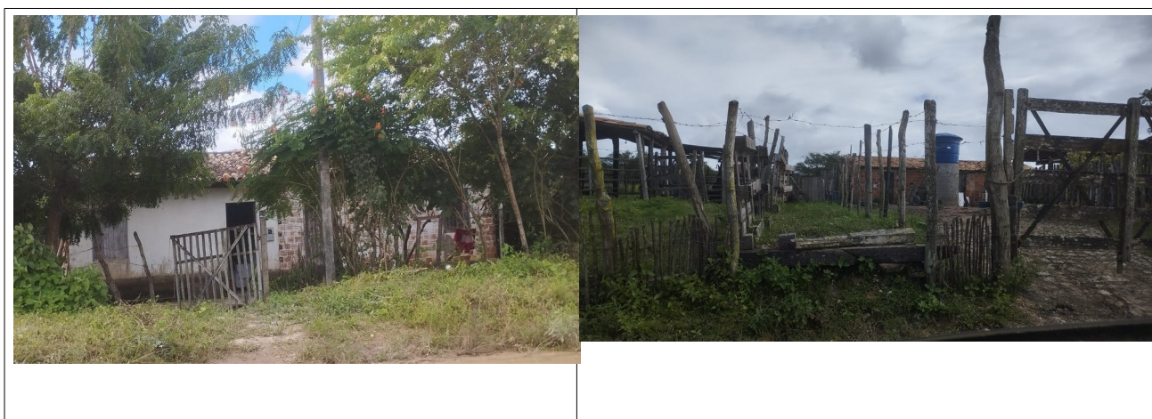
Figura 01 a e b – Conteúdos do Campo na Paisagem do Bairro Comunidade Jardim Campo Novo, 2025.

Ali, reside uma população periférica, segregada pelos processos imobiliários (construção de condomínios de médio padrão pelo PMCMV (2010) 5 .