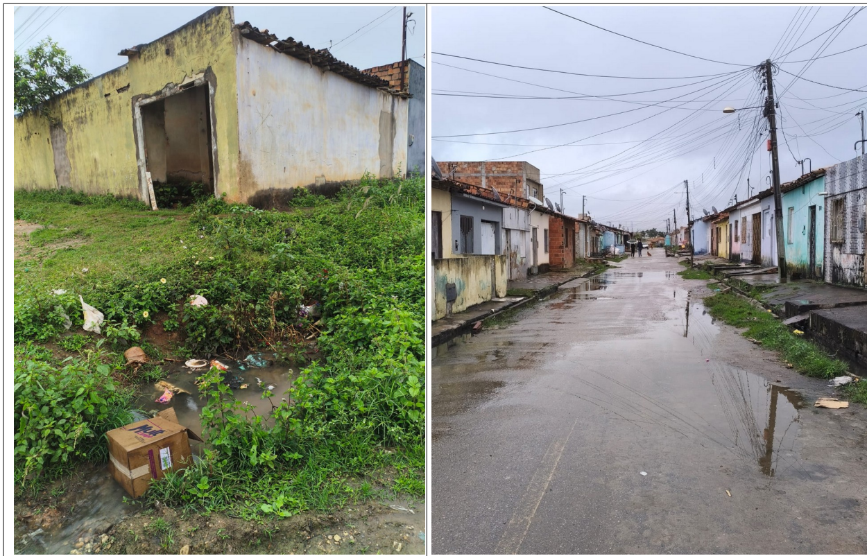
Figura 02 – Urbanização Precária no Bairro Comunidade Jardim Campo Novo, 2025

resistem as famílias em pequenas unidades familiares reproduzindo a dinâmica do campo (criação de animais, cultivos agrícolas) e a vida em comunidade.