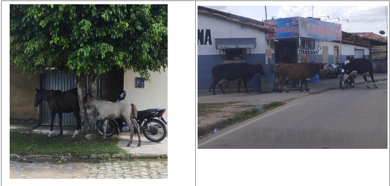
Figura 02 c e d – Conteúdos do Campo na Paisagem do Bairro Comunidade Jardim Campo Novo, 2023.