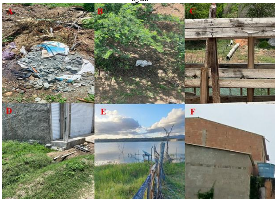
Figura 2 – Condições ambientais e sanitárias do entorno: (A) manejo inadequado de resíduos; (B) poluição nas margens; (C e D) lançamento de efluentes; (E e F) sistemas de captação e armazenamento de água.

A Figura 2A evidencia a disposição inadequada e a queima de resíduos sólidos próximas a residências e áreas de cultivo agrícola (abobrinha), enquanto a Figura 2B demonstra o acúmulo de resíduos plásticos nas margens do reservatório, reflexo da