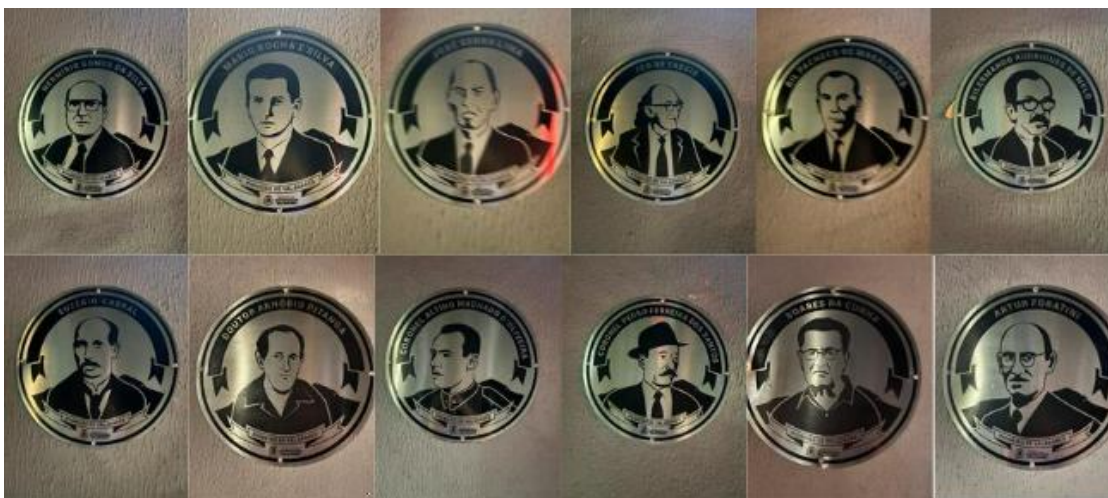
Imagem 03 - Placas do Memorial

Nas figuras seguintes é possível observar as placas.