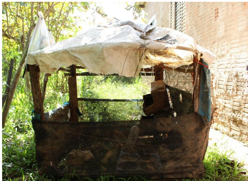
Figura 2 – Primeiro aviário móvel construído na propriedade da Dona Eliana, com materiais encontrados no entorno.

dão sentido às experiências de transformação nos territórios. A partir de suas experiências com o primeiro aviário, dona Eliana propõe melhorias ajustadas ao seu contexto, e gradualmente atinge autonomia técnica.