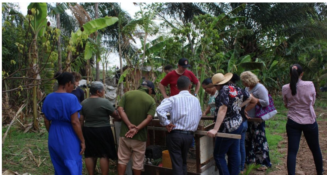
Figura 5 – Oficina para demonstração do aviário, no Sítio Águas Rasas em Nova Olímpia.

pública se encontram em torno de um objeto concreto para debater manejo, materiais, custos e possibilidades de reprodução da experiência. Unidades demonstrativas desse tipo são amplamente reconhecidas na extensão rural como dispositivos privilegiados de comunicação técnica e de aprendizagem coletiva, justamente porque permitem que agricultores vejam na prática o funcionamento das tecnologias, questionem, proponham ajustes e relacionem o que observam com sua própria realidade produtiva.