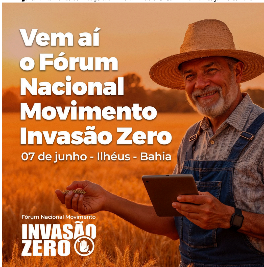
Figura 1: Banner de convite para o 1º Fórum Nacional do MIZ em 07 de junho de 2025

Sul da Bahia, 2025). Durante o evento, foi assinado um manifesto contrário às denominadas “invasões” promovidas pelos movimentos de luta pela terra, a exemplo do MST e reivindicando dos governos estaduais e federais maior segurança jurídica no campo, garantindo o direito à propriedade privada.