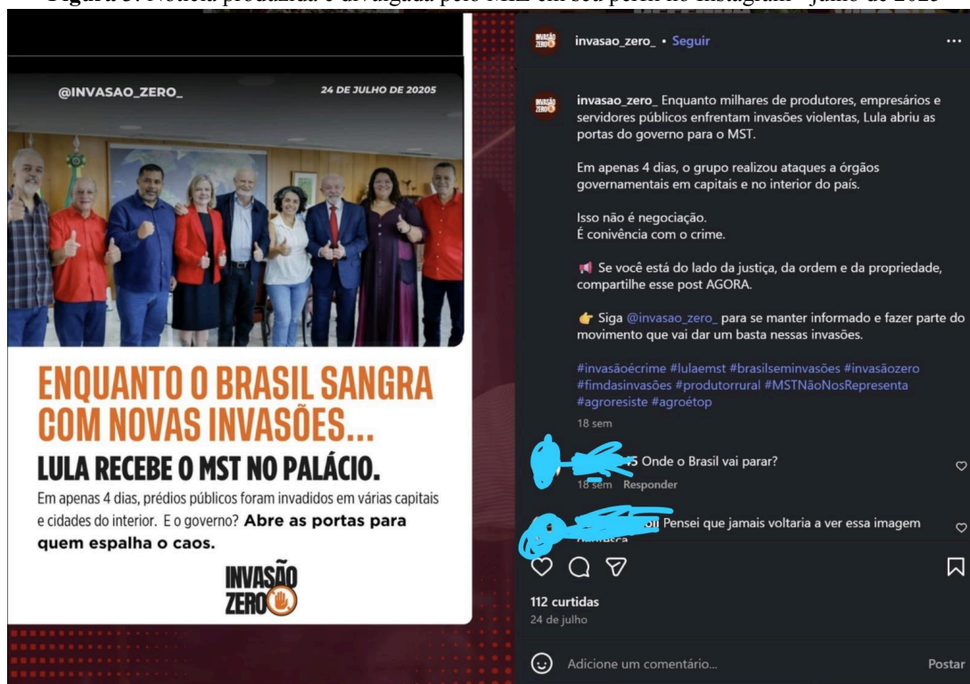
Figura 3: Notícia produzida e divulgada pelo MIZ em seu perfil no Instagram - julho de 2025

Tanto a campanha quanto a Lei são uma medida para se opor à Jornada Nacional de Lutas em Defesa da Reforma Agrária do MST conhecida como Abril Vermelho, especialmente no ano passado, quando o movimento comemorava 40 anos de luta pela reforma agrária. Não somente em âmbito do Poder Legislativo o MIZ busca se articular, mas também – e sobretudo – construindo narrativas e divulgando em suas redes sociais, criminalizando os movimentos socioterritoriais – com destaque ao MST – e, da mesma forma, o governo de Lula III, que demonstra maior abertura para dialogar e negociar com o movimentos. Os ataques são realizados em grupos de redes sociais e também no perfil do Instagram da organização, como demonstra a Figura 3, com a “notícia” intitulada “Enquanto o Brasil Sangra Com Novas Invasões, Lula Recebe o MST no Palácio”. Mesmo que a data desta notícia seja julho de 2025 e o recorte do artigo foi definido como até junho, consideramos o material de extrema relevância e poder de síntese da articulação ruralista.