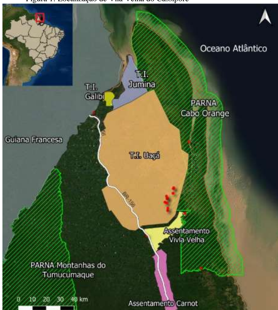
Figura 1: Localização de Vila Velha do Cassiporé

A pesquisa foi realizada no Assentamento de Vila Velha do Cassiporé, que está distante aproximadamente 170 quilômetros da sede do município de Oiapoque, teve abordagem qualitativo-quantitativo por meio de estudo de caso, com características significativas para o estudo. Foi realizada pesquisa de campo, aplicação de questionário, diário de campo ou de observação, consulta de documentos, filmagem, registro fotográfico, gravação de imagens do Assentamento de Vila Velha do Cassiporé e entrevista semi-dirigida com a gestão do Instituto Chico Mendes e Conservação da Biodiversidade (ICMBIO). Na figura 1 (faixa de terras em amarelo), mostra a localização de Vila Velha do Cassiporé, que faz limite com a Terra Indígena Uaçá e Parque Nacional do Cabo Orange.