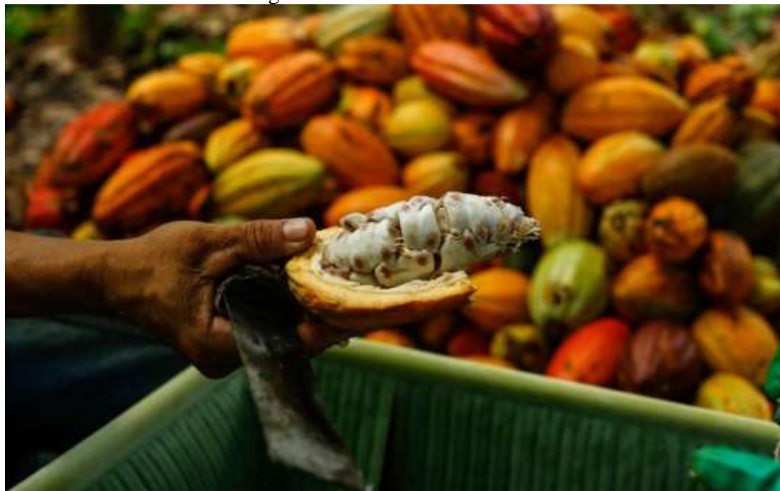
Figura 4: Cacau ao ser coletado.