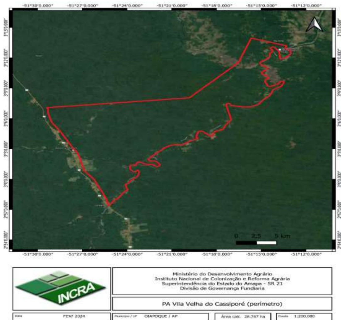
Figura 1: Projeto de Assentamento Vila Velha do Cassiporé

08 A 12 DE OUTUBRO DE 2025 | UFMS | TRÊS LAGOAS - MS