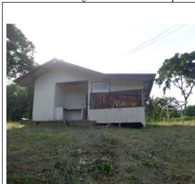
Figuras 5 e 6: Sede da Empresa Cacau Cassiporé em Vila Velha do Cassiporé

Após coleta do cacau as sementes são compradas pela empresa Cacau Cassiporé (empresa vinculada a Associação Agroextrativista do Cassiporé, que armazena as sementes in natura e o beneficiamento ocorre na sede do município de Oiapoque.