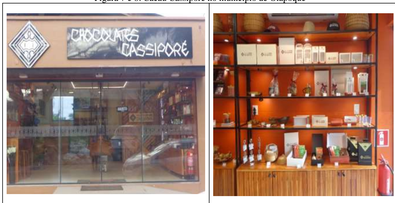
Figura 7 e 8: Cacau Cassiporé no município de Oiapoque

Na sede do município de Oiapoque o cacau é beneficiado e transformado em subprodutos para venda, onde ocorre o consumo local e regional dos produtos, como mostra a figura 7 e 8.