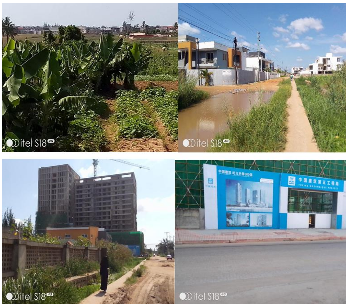
Fig 01: Expansão da indústria imobiliária nos campos das famílias camponesas

08 A 12 DE OUTUBRO DE 2025 | UFMS | TRÊS LAGOAS - MS