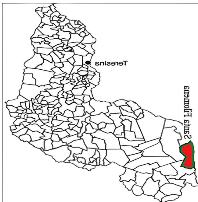
Figura 1 – Mapa de localização geográfica do município de Santa Filomena, no Piauí

municipal. Tais financiamentos priorizam a expansão da fronteira agrícola e o uso exorbitante de transgênicos e agrotóxicos ( Ibidem ).