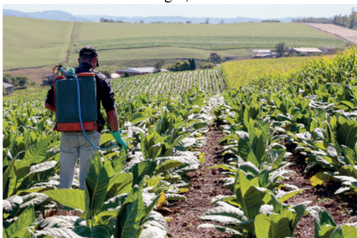
Figura 6 - Pulverização de agrotóxicos em plantação na zona rural do município de Arroio do Tigre, RS