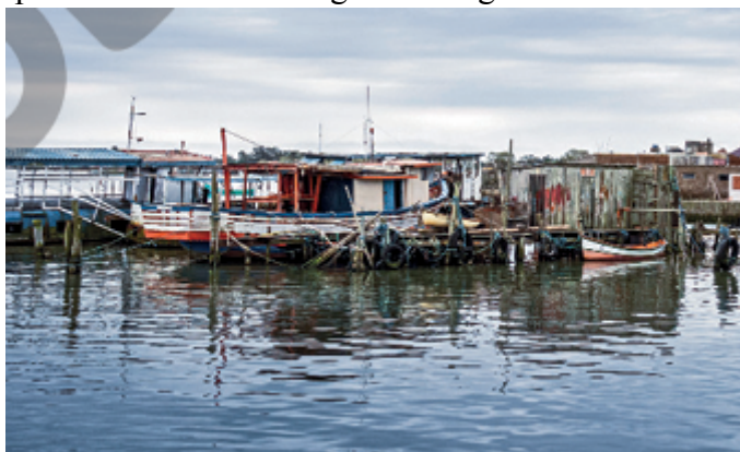
Figura 4 - Barcos de pesca artesanal na margem da Lagoa dos Patos em São José do Norte, RS