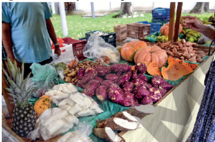
Figura 1 - Feira de produtos orgânicos no Rio de Janeiro

Esta definição possui restrições conceituais pois apresenta a produção orgânica como àquela sem agrotóxicos, mas, sem mencionar que pode ser feita em forma de monocultura por grandes empresas, concepção que não é suficiente para libertar as pessoas do sistema alimentar dominante.