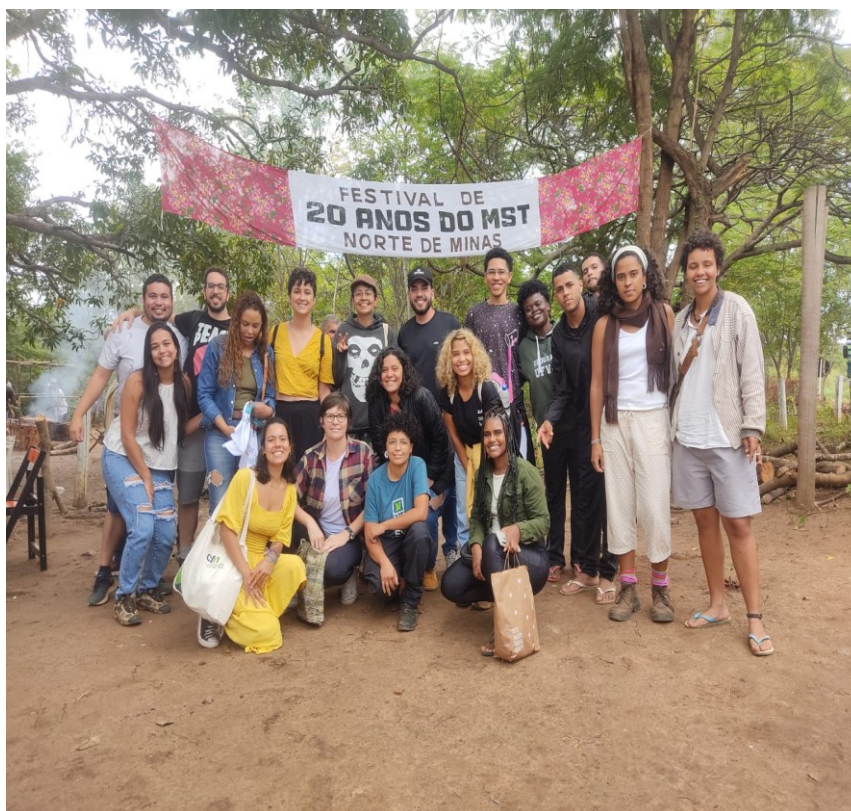
Figura 01:UFVJM no Festival de 20 anos do MST — Assentamento Estrela do Norte, Montes Claros (MG).

Um dos principais movimentos do país, chegou ao Vale em 1988 e atua com famílias camponesas na luta pela reforma agrária. A presença e atuação do MST no Vale do Jequitinhonha se entrelaçam com uma memória histórica rica e diversa, que envolve não apenas os trabalhadores rurais sem terra, mas também povos indígenas, comunidades quilombolas e grupos camponeses que lutam por justiça social e dignidade no campo (Santos, 2024)