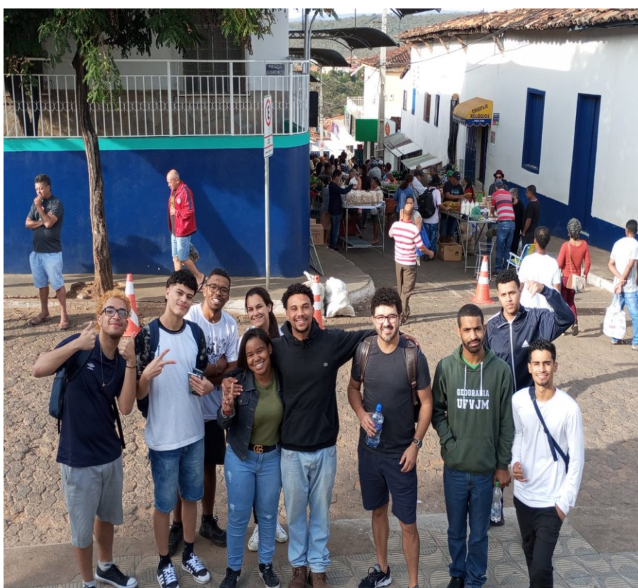
Figura 03-Feira Livre em Minas Novas, tradicional pela oferta de alimentos e artes produzidas na região.

Presente em praticamente todos municípios, como Turmalina e Araçuaí, representam os direitos trabalhistas, previdenciários e sociais dos trabalhadores do campo, atuando como protagonistas históricos nas lutas pela reforma agrária e pela dignidade no meio rural. Segundo Amaral e Neiva (2021) os Sindicatos dos Trabalhadores Rurais (STR) configuram um forte apoio consistente as mobilizações camponesas. No Nordeste mineiro, a organização sindical existe desde a década de 1950, e passou a contar com a FETAEMG – Federação dos Trabalhadores na Agricultura do Estado de Minas Gerais- organização que fortaleceu as lutas pelos direitos trabalhistas dos povos do campo em Minas, atuando nos limites do Estatuto da Terra (1964).