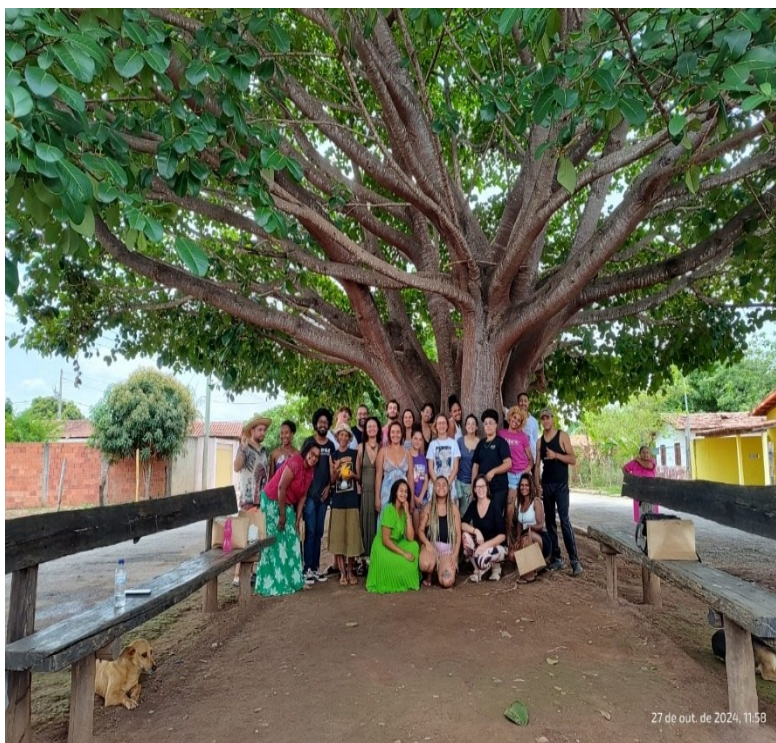
Figura 02-Roda de conversa com mulheres artesãs da comunidade Campo Buriti, que sustentam suas famílias por meio do artesanato de argila.

08 A 12 DE OUTUBRO DE 2025 | UFMS | TRÊS LAGOAS - MS