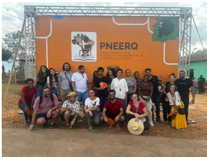
Figura 05- Participação no evento comemorativo dos 10 dias de criação do Campus Quilombo IFNMG, em Minas Novas (MG).

Fundada em 2016, articula a luta das comunidades quilombolas pelo reconhecimento dos territórios tradicionais, pelo acesso a políticas públicas específicas e pelo fortalecimento da identidade negra rural da região. Segundo o site oficial do IFNMG, o dia 08 de fevereiro de 2024, foi um dia histórico para os povos e comunidades tradicionais de Minas, pois o governo federal anunciou a implantação de um novo campus do Instituto Federal do Norte de Minas Gerais (IFNMG) em Minas Novas, no Vale do Jequitinhonha: O campus Quilombo. A proposta construída desde o início de 2023 de forma coletiva, é fundamental para o fortalecimento da agricultura familiar e da autonomia dos povos do campo. O instituto ainda destacou que “é uma reparação histórica para as comunidades quilombolas e para o Vale do Jequitinhonha, que por tantos anos sofreram e continuam sofrendo com exclusão, racismo e exploração”.