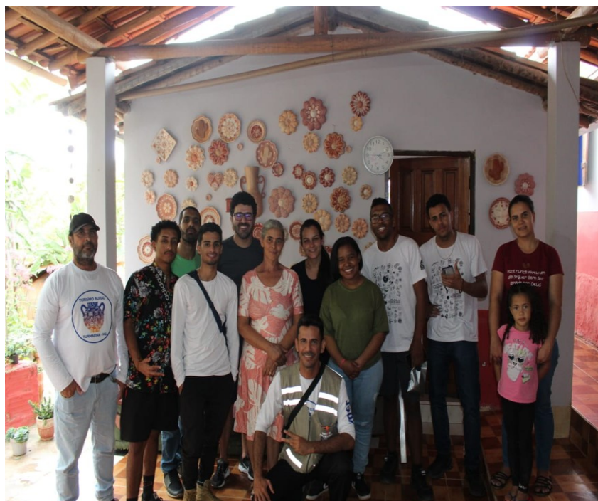
Figura 04-Roda de conversa com artesãos do Vale do Jequitinhonha, com participação de professor e alunos da UFVJM, 2023.

08 A 12 DE OUTUBRO DE 2025 | UFMS | TRÊS LAGOAS - MS