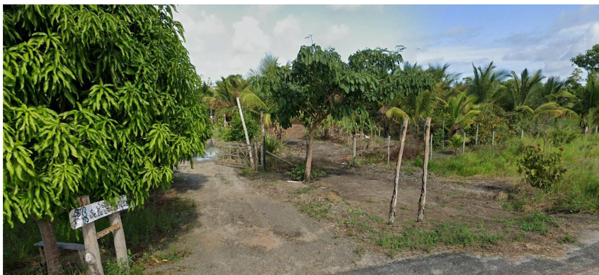
Entrada de uma unidade familiar. Registro do autor. 2022.

Todas as fotos referem-se a lugares por onde fomos apresentados, o que demonstra a importância de expor determinados elementos de seu modo de vida. Ressaltaram a produção de gêneros agrícolas que, além de abastecer parte do consumo familiar, também é comercializado externamente; o viveiro de mudas nativas que, somado a referência das lagoas, reafirma a preocupação ecológica daquele ambiente; e a entrada de uma unidade familiar que, visivelmente, se apresenta sob uma diversidade de espécies vegetais.