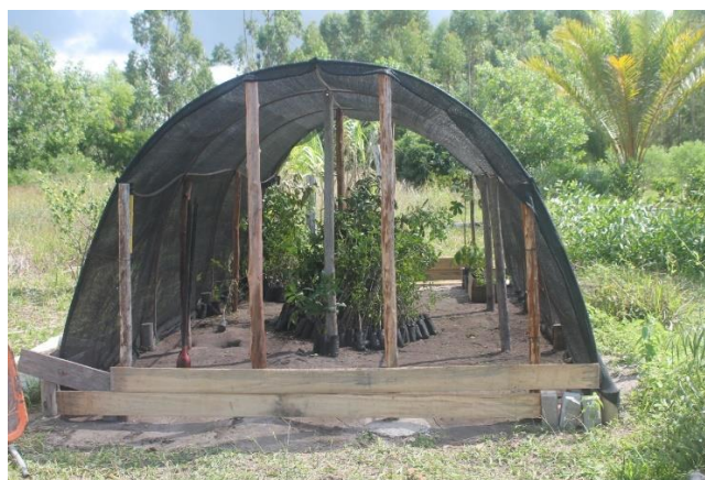
Quintal produtivo e viveiro de nativas. 2022.