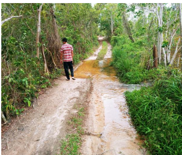
Imagem 07 e 08 – Rompimento de estrada.

A retomada do córrego Velha Antônia, realizada sob áreas de monocultivos, vem provocando alterações do território e, conseqüentemente, em suas paisagens. A seguir, apresentamos registro do rompimento de uma estrada pelas águas do córrego, devido a recarga hídrica de seu leito, e a proximidade de uma lagoa.