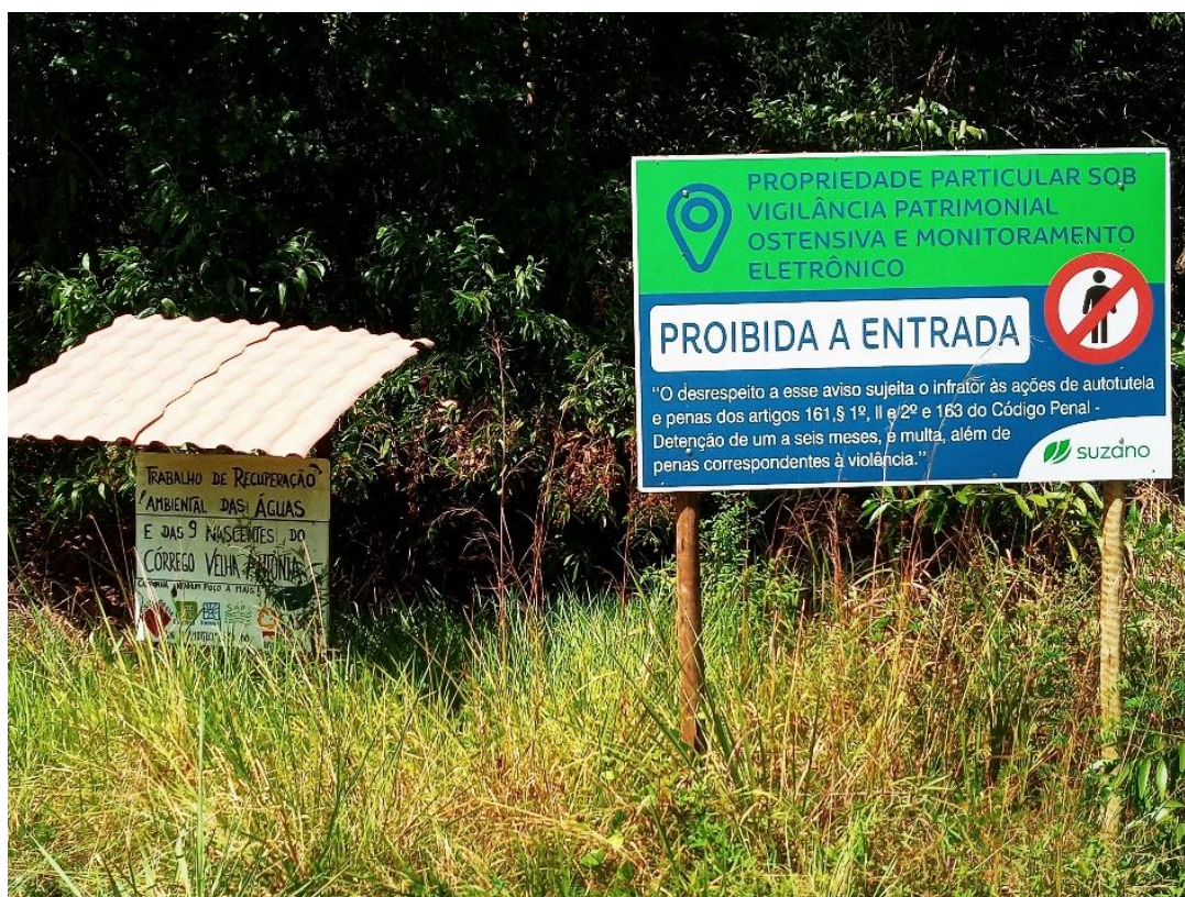
Imagem 06 – Disputa territorial via comunicação: