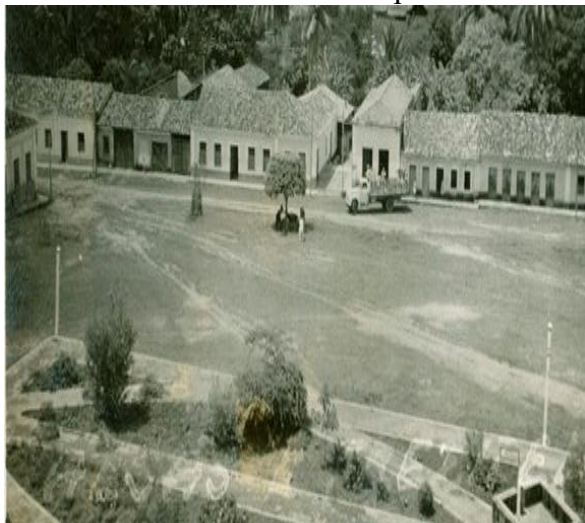
Foto 1 - Primórdios do Município de Balsas