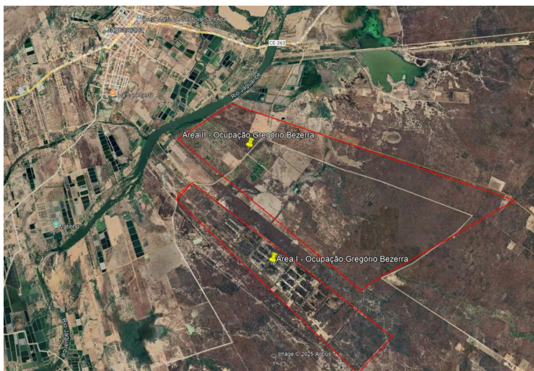
Figura 1 – Recorte espacial da área de estudo