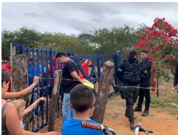
Fotografia 1 – Registro de jagunços na entrada da ocupação a fim de coagir as famílias

rural familiar como a unidade básica da organização econômica e social - nesse caso caracterizada pela luta da terra; b) a agricultura como a principal fonte de sobrevivência - principal atividade praticada pela comunidade; c) a vida em aldeia e a cultura específica das pequenas comunidades rurais - expressas na organização social e política reforçando o senso de comunidade existente na ocupação; e, d) a situação oprimida, isto é, a dominação e exploração dos camponeses por forças externas - impressa nas ofensivas violentas contra as famílias e a falta da asseguaração de seus direitos por parte do Estado.