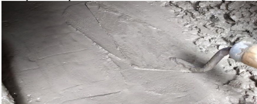
Figura 01: Aspecto da superfície do concreto com teor ideal de argamassa \alpha = 0,50 .

No entanto, devido à limitação de tempo, sugere-se que futuros estudantes deem continuidade à pesquisa, aperfeiçoando-a para alcançar os resultados esperados. Apesar de não ter atingido plenamente os objetivos iniciais, o projeto contribuiu significativamente para o aprendizado dos estudantes. Além disso, foi elaborado um resumo simples, submetido e apresentado no VII Semana de Edificações e Engenharia, realizado no período de 28 a 31 de Novembro de 2024 no Instituto Federal do Norte de Minas Gerais - Campus Pirapora .