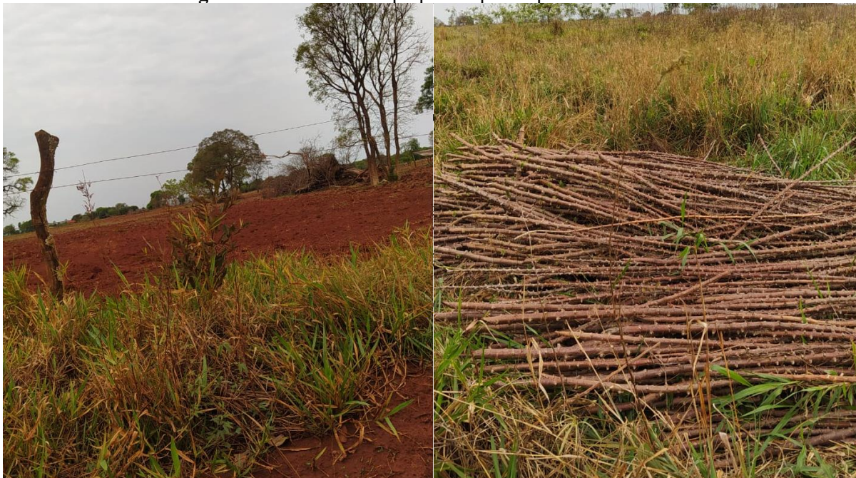
Imagem 3 e 4: Área sendo preparada para o plantio de mandioca