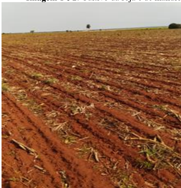
Imagem 1 e 2: Cultivo da soja e de mandioca nos lotes vizinhos de um dos entrevistados

No assentamento “ Estrela ” essas transformações podem ser observadas nas imagens abaixo.