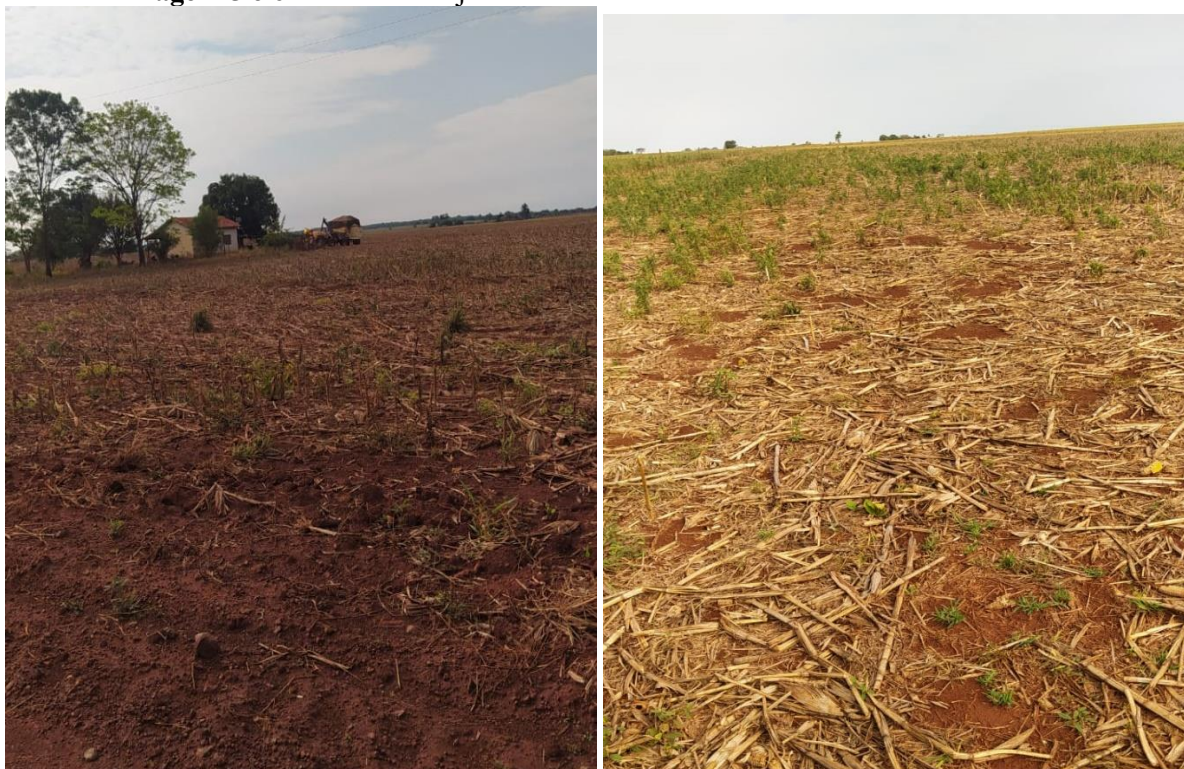
Imagem 5 e 6: Cultivo da soja e milho nos lotes vizinhos de um dos entrevistados