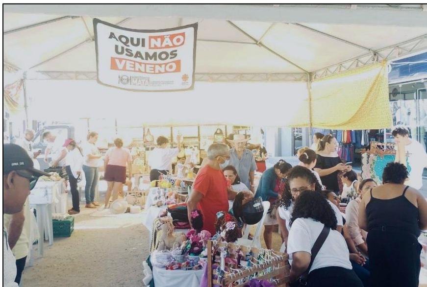
Figura 1 – A participação feminina na feira camponesa da FAESP em Limoeiro do Norte-CE.

As figuras 1 e 2, na sequência, revelam o cotidiano da feira camponesa, evidenciando práticas, relações e dinâmicas que configuram esse espaço como um território socialmente construído. Observa-se a centralidade da participação feminina na organização das bancas, na exposição dos seus produtos e na mediação das interações com os consumidores, expressando processos de autonomia, solidariedade e produções de sociabilidade.