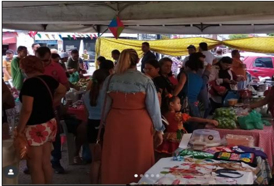
Figura 2 – A feira camponesa da FAESP, em Limoeiro do Norte-CE.

08 A 12 DE OUTUBRO DE 2025 | UFMS | TRÊS LAGOAS - MS