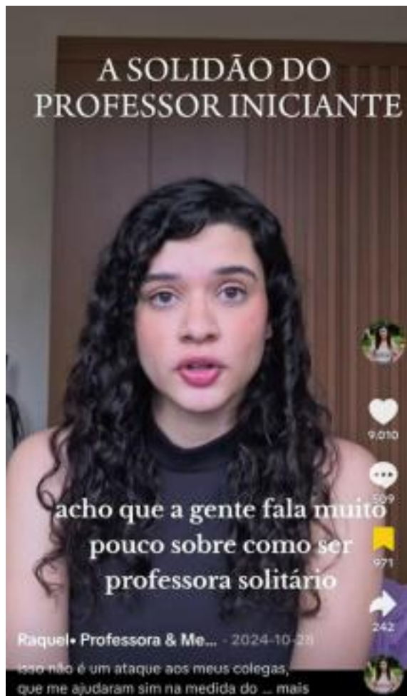
Figura 2 – Vídeo postado pela @prof.raqueldms

Este vídeo, publicado em 28 de outubro de 2024, tem mais de 9 mil curtidas, 509 comentários, 971 pessoas salvaram o conteúdo e 242 compartilharam; de certa forma, ele estabelece um diálogo com o vídeo da figura 1. A professora traz um relato acerca da solidão do professor iniciante, ela já começa falando sobre como essa questão é pouco relatada. Ademais, pontua que quando iniciou a profissão sabia muito pouco sobre a instituição escolar, a respeito de seu funcionamento, regras e burocracia, pois para ela, chegaria à escola e receberia informações que pudessem ajudá-la em sua prática docente; entretanto, isso não aconteceu e ela acabou ficando desamparada nos primeiros meses, o que a entristeceu.