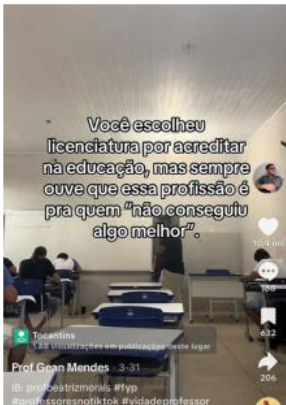
Figura 4 – Vídeo postado pelo @profgeanmendes

Nos comentários, muitos professores relatam que estão passando e/ou passaram por isso; alguns falam que desistiram da docência devido a essas angústias que marcam o início da prática docente. Sendo assim, conclui-se que nem todos conseguem passar pelos obstáculos desse momento, daí a relevância de receberem apoio ainda na formação inicial, a fim de prosseguirem na profissão.