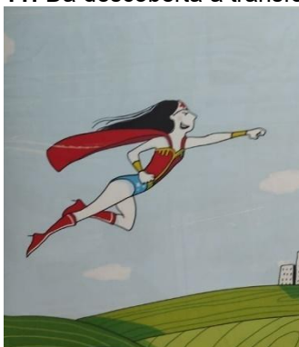
Figura 11: Da descoberta à transformação

Em outras palavras, Marguerite percebeu que não está sozinha no mundo, já que há outras pessoas com atitudes e jeitos semelhantes.