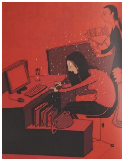
Figura 3: Dificuldades no trabalho em equipe

a) Déficits persistentes na comunicação social e na interação social, em múltiplos contextos: