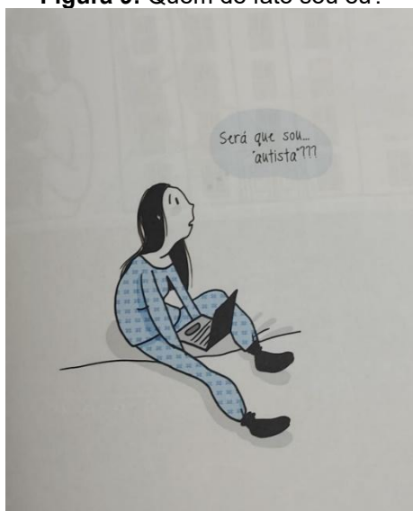
Figura 9: Quem de fato sou eu?

O indivíduo não percebe mais seu lugar. Embora muitas vezes ele tenha se sentido à margem e tentado acomodar-se, desta vez ele não tem mais força, ou talvez nunca a tenha tido (Le Breton, 2018). Na internet, seus sintomas aparentes lhe deram uma pista e um caminho a seguir.