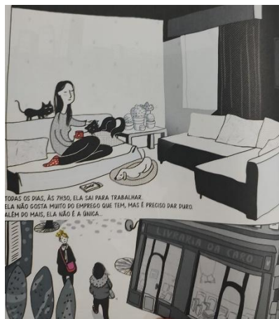
Figura 5: A necessidade das rotinas

b) Padrões restritos e repetitivos de comportamento, interesses ou atividades: