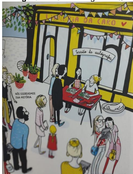
Figura 12: Como surgiu a HQ

Vemos enfim que, com o autoconhecimento, a personagem encontrou um novo olhar sobre si mesma. Nesse sentido, Bruno e Couto (2019) defendem que a cibercultura 4 , fenômeno da pós-modernidade, não pode ser reduzida ao mero uso das tecnologias, pois ao reduzir distâncias, possibilita o intercâmbio entre as pessoas, criando novas formas de produção de conhecimento e de comunicação.