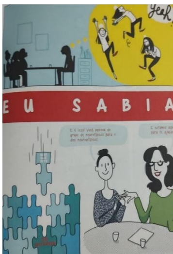
Figura 10: O caminho para o diagnóstico