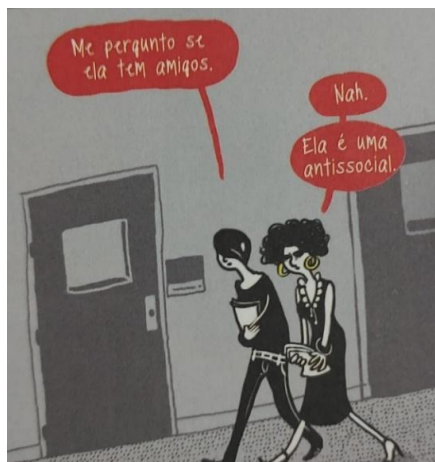
Figura 2: Como as pessoas do espectro podem ser vistas em seus grupos sociais