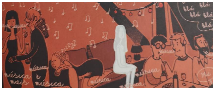
Figura 4: Dificuldades para participar de eventos sociais