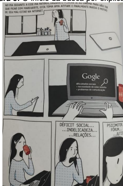
Figura 8: O início da busca por explicações

forma percebemos que, com o uso crítico da internet, ela pode ser uma aliada do homem.