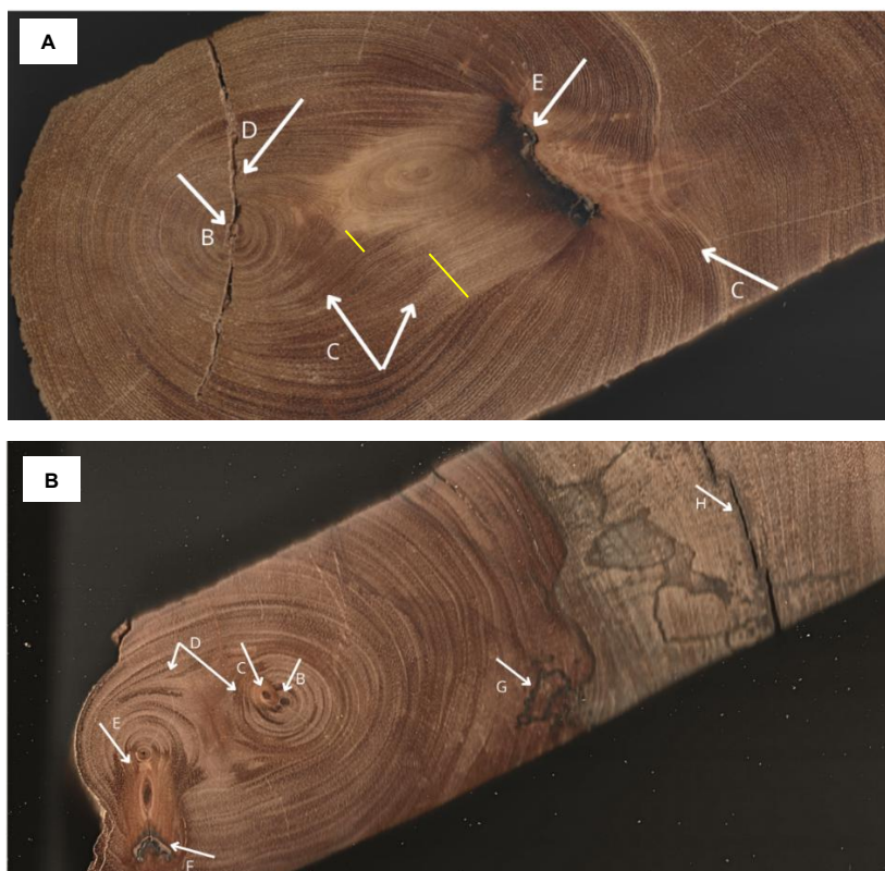
FIGURA 3. (A) Amostra GUA3A - Clarisia sp. ; B. Medula 01; C. Anéis de crescimento irregulares, com variação na espessura e direção dos anéis; D. Rachadura próxima à medula; E. Injúria de coloração negra, associada a processos cicatriciais. (B) Amostra TAU1A - Couratari sp. ; B. Medula; C. Nó adjacente próximo a medula; D. Desvio/Deformação dos anéis; E. Nó apresentando forte anomalia dos anéis e mudança de cor; F. Zona escurecida e fissurada; G. Mancha escura/alteração da cor; H. Rachaduras.

Essa variação na extensão das cronologias entre amostras de um mesmo indivíduo pode ser explicada pela influência de fatores ambientais, histórico e particularidades anatômicas das árvores. Ressalta-se que as anomalias e defeitos anatômicos observáveis durante a medição dos anéis também podem representar dificuldades e gerar variações nas cronologias. Tanto o tauari quanto a guariúba apresentaram deformidades no lenho, como ocorrência de múltiplas medulas, rachaduras, confluência de anéis, cicatrizes da atuação do fogo e ataque de fungos (Fig. 3).