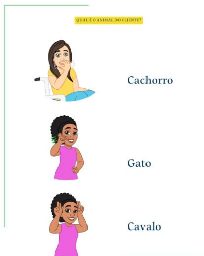
Figura 1: exemplo manual pet shop.

O manual para agências bancárias, por exemplo, reúne 49 termos e expressões, incluindo nomes de bancos, operações financeiras e serviços relacionados (como “saque”, “depósito”, “pix”, “cartão de débito” e “empréstimo”). A escolha desse segmento revelou uma dificuldade particular: muitos sinais não possuem registro formal ou são pouco padronizados, variando entre regiões e grupos. Essa escassez de sinais evidencia a carência de produção terminológica na Libras para áreas específicas, refletindo um desafio mais amplo no desenvolvimento da língua. O manual para caixas de estabelecimentos (PDV) contém 16 termos relacionados a formas de pagamento e cumprimentos básicos, enquanto o manual para pet shops contempla sinais sobre animais, produtos e serviços, como “banho e tosa” ou “ração”.