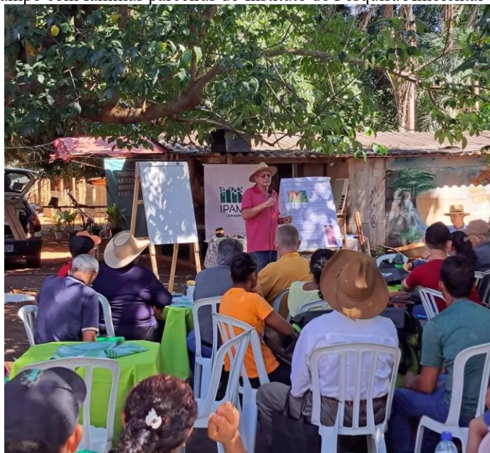
Figura 6 – Dia de Campo com famílias parceiras do Instituto de Pesquisa Ambiental da Amazônia (IPAM)