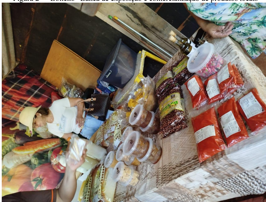
Figura 2 – “Bolicho” Banca de exposição e comercialização de produtos locais