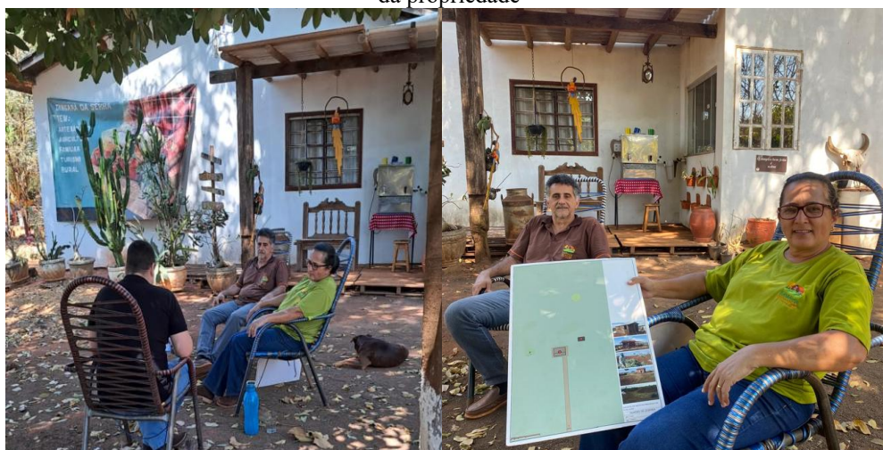
Figura 4 - Fase de coleta de dados: momento de explanação dos produtores sobre as estratégias de gestão da propriedade

Esse depoimento evidencia que a formalização, além de requisito administrativo, é uma estratégia de empoderamento econômico e institucional, pois garante reconhecimento legal e acesso a mecanismos de fomento que impulsionam a gestão solidária e o desenvolvimento territorial.