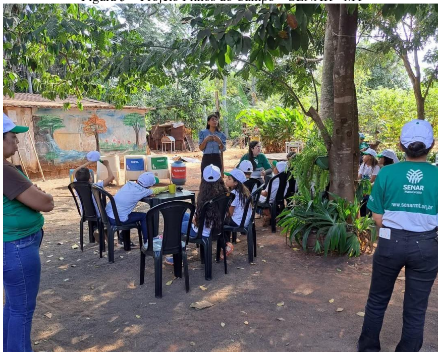
Figura 5 – Projeto Filhos do Campo – SENAR - MT