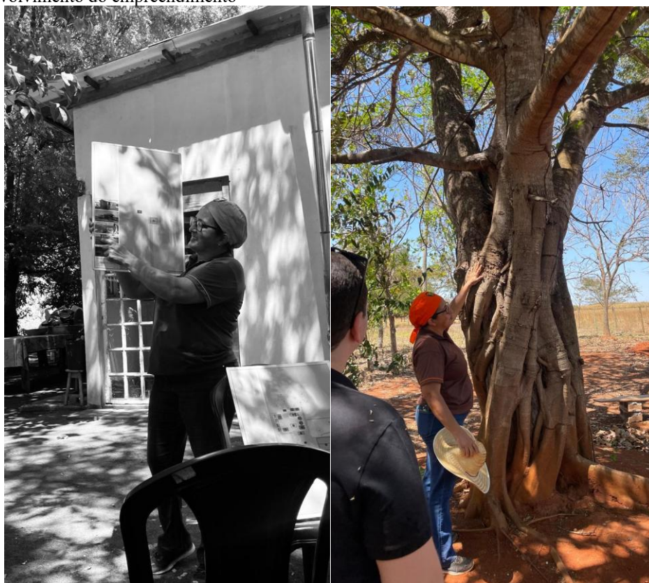
Figura 3 – Visita guiada à propriedade rural, com destaque para a explanação da produtora sobre as fases de desenvolvimento do empreendimento

Além disso, a análise permite compreender que a inovação social presente nessa experiência não se limita à adoção de novas práticas produtivas, mas se expressa na capacidade de transformar relações sociais e modos de gestão. A entrevistada evidencia que, mesmo sem o apoio inicial da comunidade, o diálogo e a persistência contribuíram para criar um ambiente de cooperação e aprendizado coletivo. Essa trajetória confirma que a inovação no meio rural nasce, muitas vezes, da resiliência dos atores locais frente às adversidades e da busca por soluções adaptadas à sua realidade. Como destaca Gil (2002), o potencial transformador das práticas sociais se manifesta quando os sujeitos passam a reinterpretar seus papéis dentro do grupo, promovendo novas formas de organização baseadas na solidariedade e no compartilhamento de saberes. Assim, a ação coletiva observada não apenas promove inclusão econômica, mas também reforça o protagonismo e a autonomia das comunidades rurais, consolidando o turismo como vetor de desenvolvimento social e identitário.