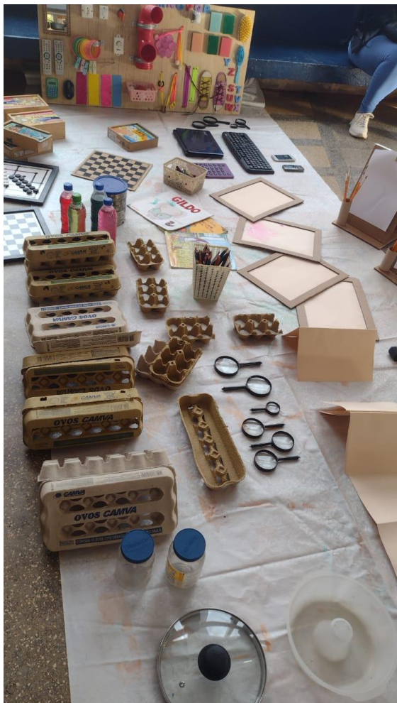
Figuras 06 e 07: Cenário montado no CMEI para início da ação a partir das materialidades