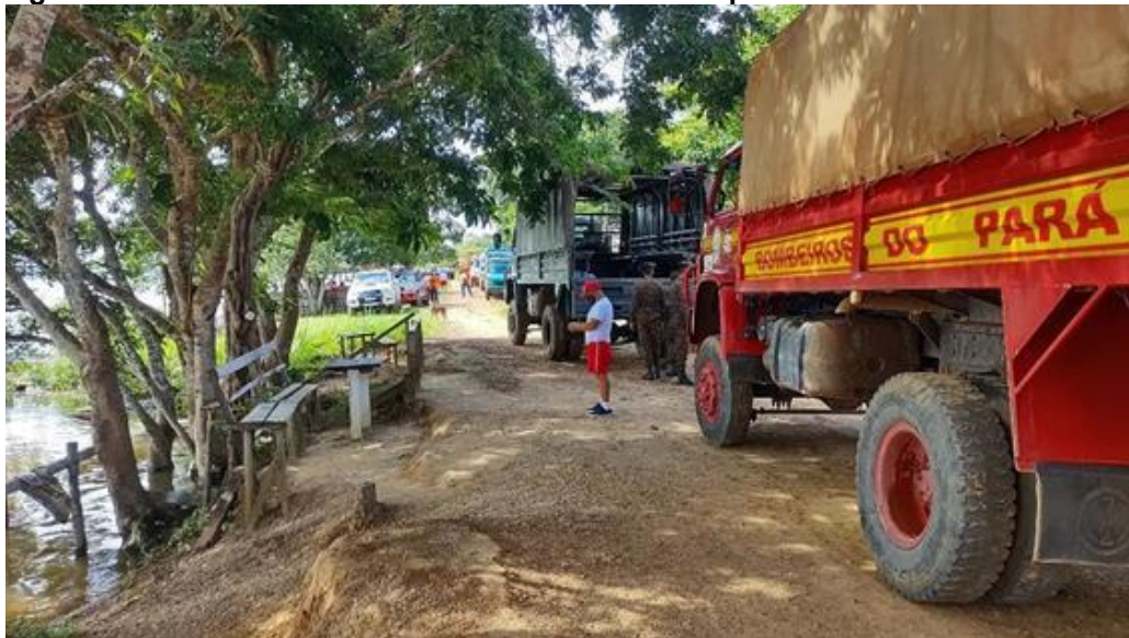
Figura 2. Retirada de famílias da Vila de Pederneira pela Defesa Civil e bombeiros

No ano de 2022, durante o período do inverno amazônico, o Rio Tocantins alcançou sua cota máxima 74 metros (setenta e quatro metros), o que gerou preocupação entre as autoridades em relação aos moradores das margens do rio. Nessa dinâmica de cheias, a água chegou esteve próxima de invadir as casas da vila, fato inédito até então. Em decorrência disso, houve mobilização da Defesa Civil, juntamente do exército e bombeiros para mobilizar a saída das pessoas, assim como salvar seus bens materiais da invasão da água, como demonstram as figuras 2 e 3.