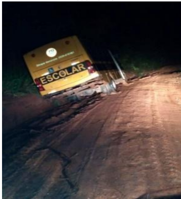
Figura 7. Ônibus atolado em época de inverno na estrada de terra que dá acesso à Vila de Pederneiras