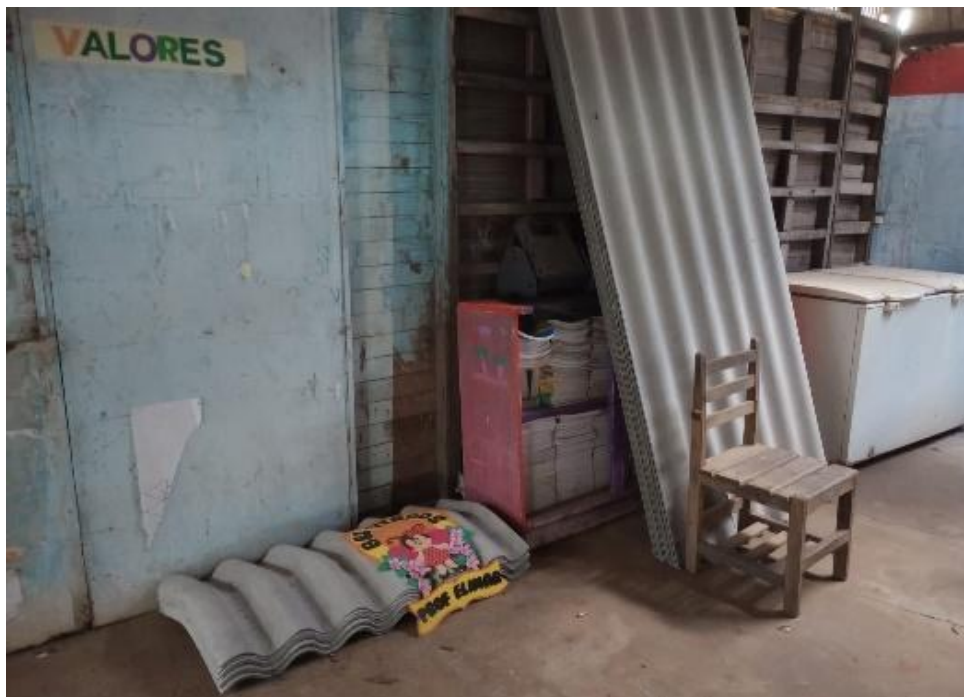
Figura 5. Sobras de livros e freezer da antiga escola da comunidade, que funcionava em um barracão antigo