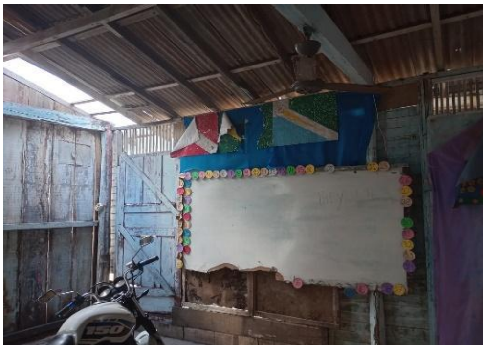
Figura 6. Antiga lousa da escola desativada