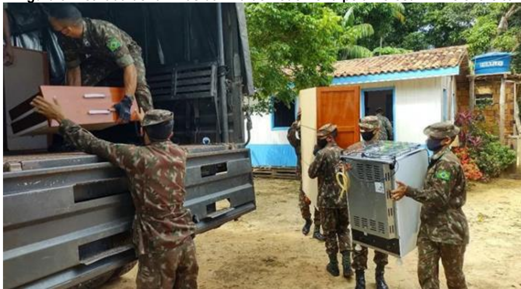
Figura 3. Retirada de famílias da Vila de Pederneira pela Defesa Civil e exército