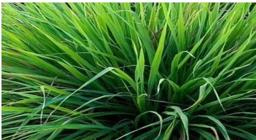
Figura 1 – Representação de C. citratus

A planta forma um denso conjunto de folhas arqueadas, medindo entre 0,60 e 1,20 m de altura. Suas folhas verde-claras, longas e estreitas, exalam aroma de limão quando amassadas e raramente produzem flores (Rojas-Armas et al. , 2020).