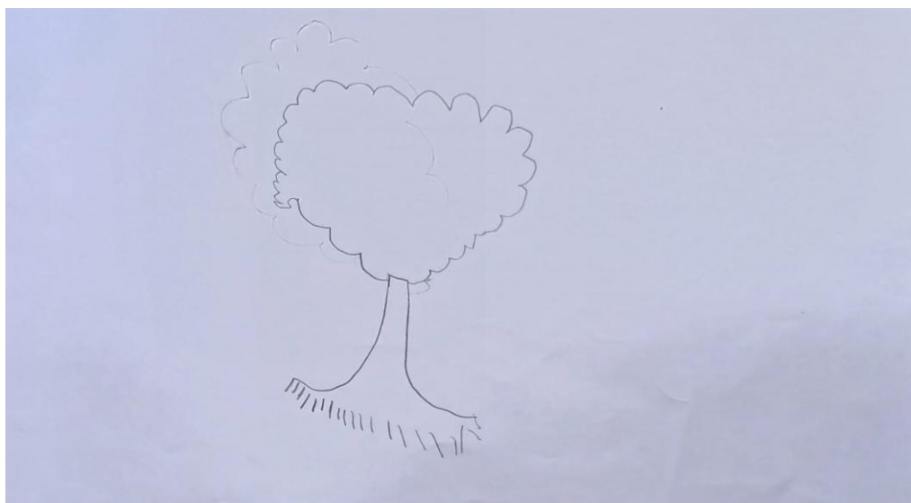
Figura 2- Desenho da Árvore- Criança A.A.S.L

Fonte: Andressa Lima, Luana Maciel, 2025.