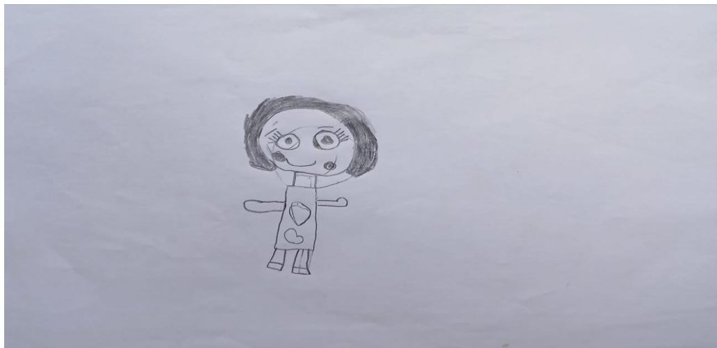
Figura 3- Figura Humana- Criança A.A.S.L

Autores: Andressa Lima, Luana Maciel,2025.