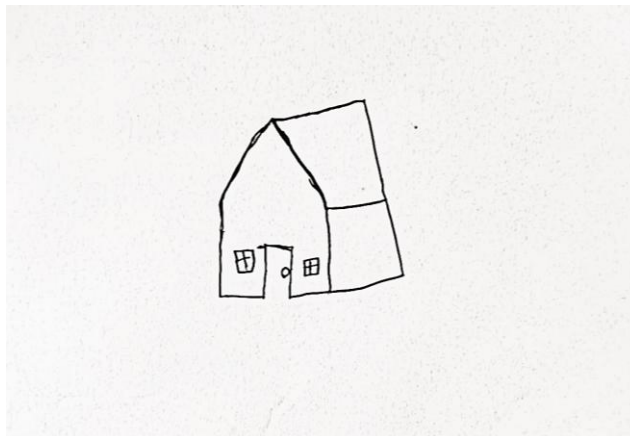
Figura 2 - Desenho da casa

A análise sugere possível rejeição da situação doméstica e dos valores familiares, com expressão compensatória de sentimentos de superioridade e revolta contra padrões tradicionais. O sujeito apresenta retraimento, dificuldade nos contatos interpessoais e falta de energia para enfrentar problemas cotidianos. Entretanto, no período de realização do desenho a criança demonstrou ser bem autêntica, esperta e cheia de energia, não demonstrou problemas socioemocionais e nem de fala.