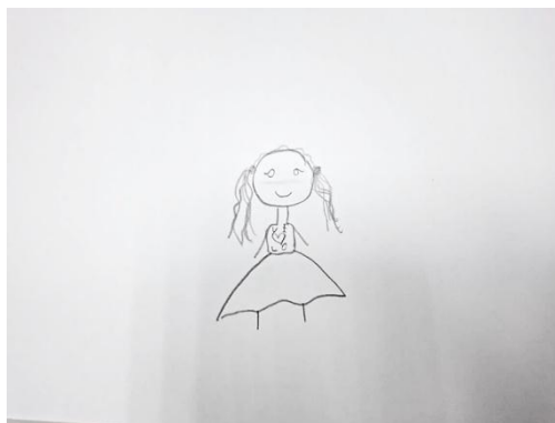
Figura 2 – Desenho da pessoa

Já o desenho da pessoa, o último solicitado, teve uma duração de aproximadamente de dois minutos e cinquenta e seis segundos. A criança se manteve neutra e concentrada durante o processo. Teve atenção com características físicas, como o cabelo e o vestido, e disse ter desenhado “a pesquisadora quando era criança”. Essa representação simbólica demonstra que a criança possui memória afetiva, por ter feito alguém importante para si mesmo, mas ao mesmo tempo, ter a presença de imaginação emocional e temporal. Campos (2000), explica que o desenho da pessoa, de acordo com a técnica HTP, traz a concepção da autoimagem e o modo que a criança compreende o mundo ao seu redor e a presença do outro. Ter desenhado uma figura do passado, demonstra que a criança tem capacidade de abstração simbólica e o desenvolvimento de vínculos emocionais.