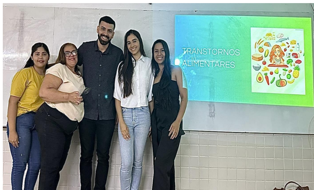
Figura 1 – Acadêmicos de enfermagem durante a palestra educativa sobre transtornos alimentares em adolescentes.

A orientação das professoras para que fosse abordado o assunto de forma de simples compreensão para o público, possibilitou que os discentes usassem maneiras estratégicas para introduzir o tema, podendo perceber o seu papel na promoção da saúde ao longo de todo o processo.