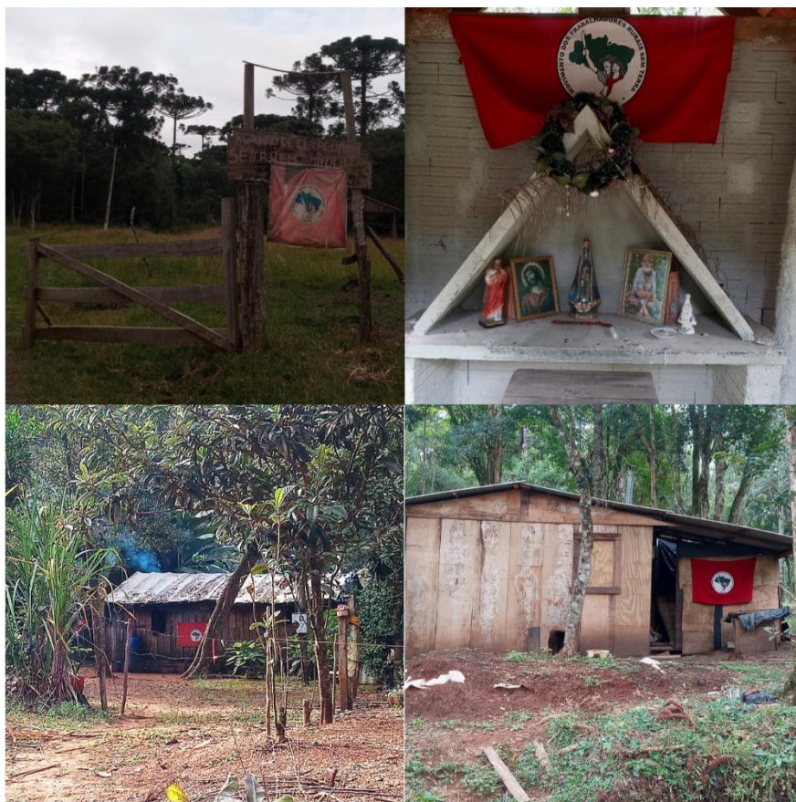
Figura 2 - Símbolos no ARC

A lona preta é mais do que uma barraca, é um rito de passagem, um símbolo presente na transição entre o acampamento e o assentamento das famílias Sem Terra, o caminho para a conquista da terra. É símbolo da luta pela Reforma Agrária que as mais de 120 mil famílias acampadas em todo Brasil carregam. A lona preta é o retrato da luta cotidiana do Movimento contra o latifúndio, a segregação e as injustiças sociais que tanto castigam esse país (MST, s/d).