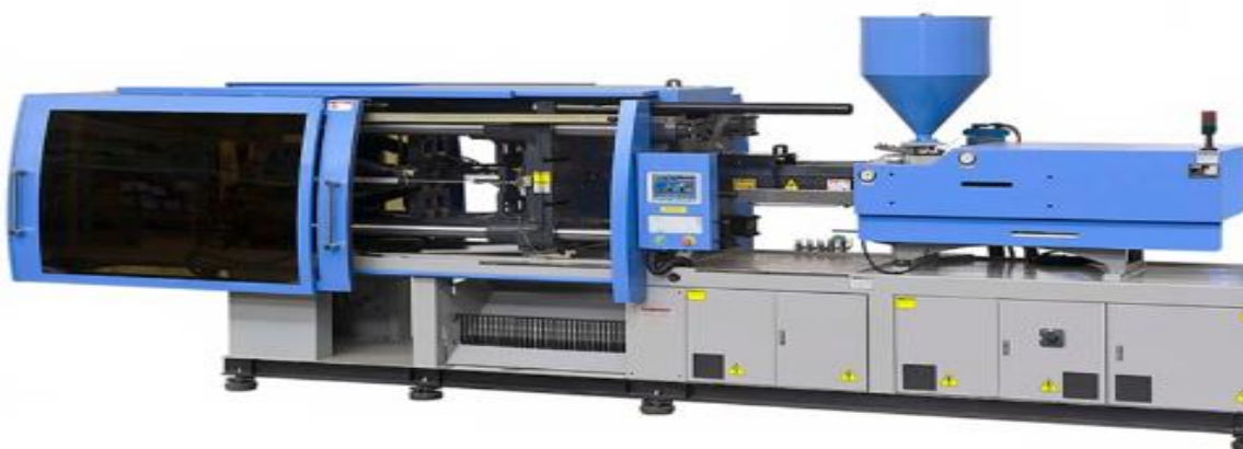
Figura 1 – Máquina injetora de plástico

A máquina injetora de plástico, mostrada na Figura 1 abaixo, é o equipamento central no processo de moldagem por injeção, sendo amplamente utilizada na fabricação de peças plásticas técnicas e de consumo, como as carcaças de eletrodomésticos produzidas pela empresa. Seu funcionamento baseia-se na introdução de material plástico fundido em um molde fechado sob alta pressão, onde o material se solidifica e adquire a forma desejada.