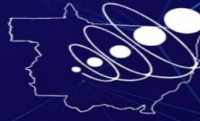
Gráfico 1 – Síntese do nível de concordância das assertivas