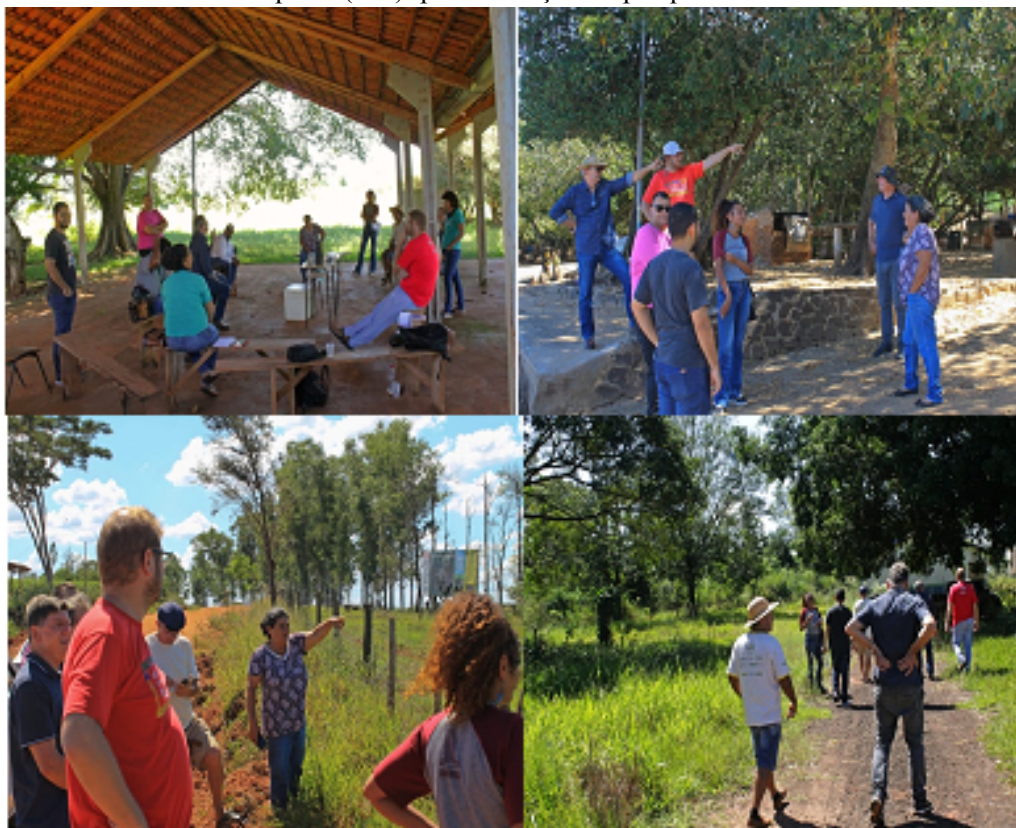
Figura 1 – PA Sul Bonito/Itaquirai (MS): primeira ação de pesquisa no assentamento – abril de 2023