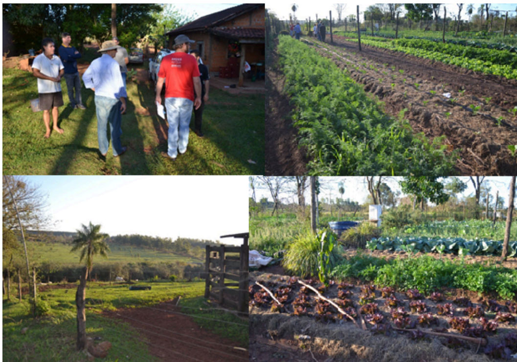
Figura 3 – Assentamento Sul Bonito/Itaquiraí (MS): lote de produção agroecológica com certificação