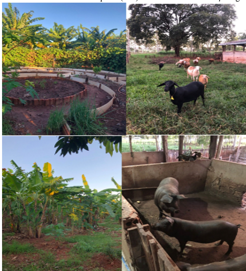
Figura 2 – Assentamento Indaiá/Itaquiraí (MS): visita a lote em transição agroecológica

Fonte: Trabalho de campo 11 abr. 2023. Foto: Jhiovanna Eduarda Braghin Ferreira.