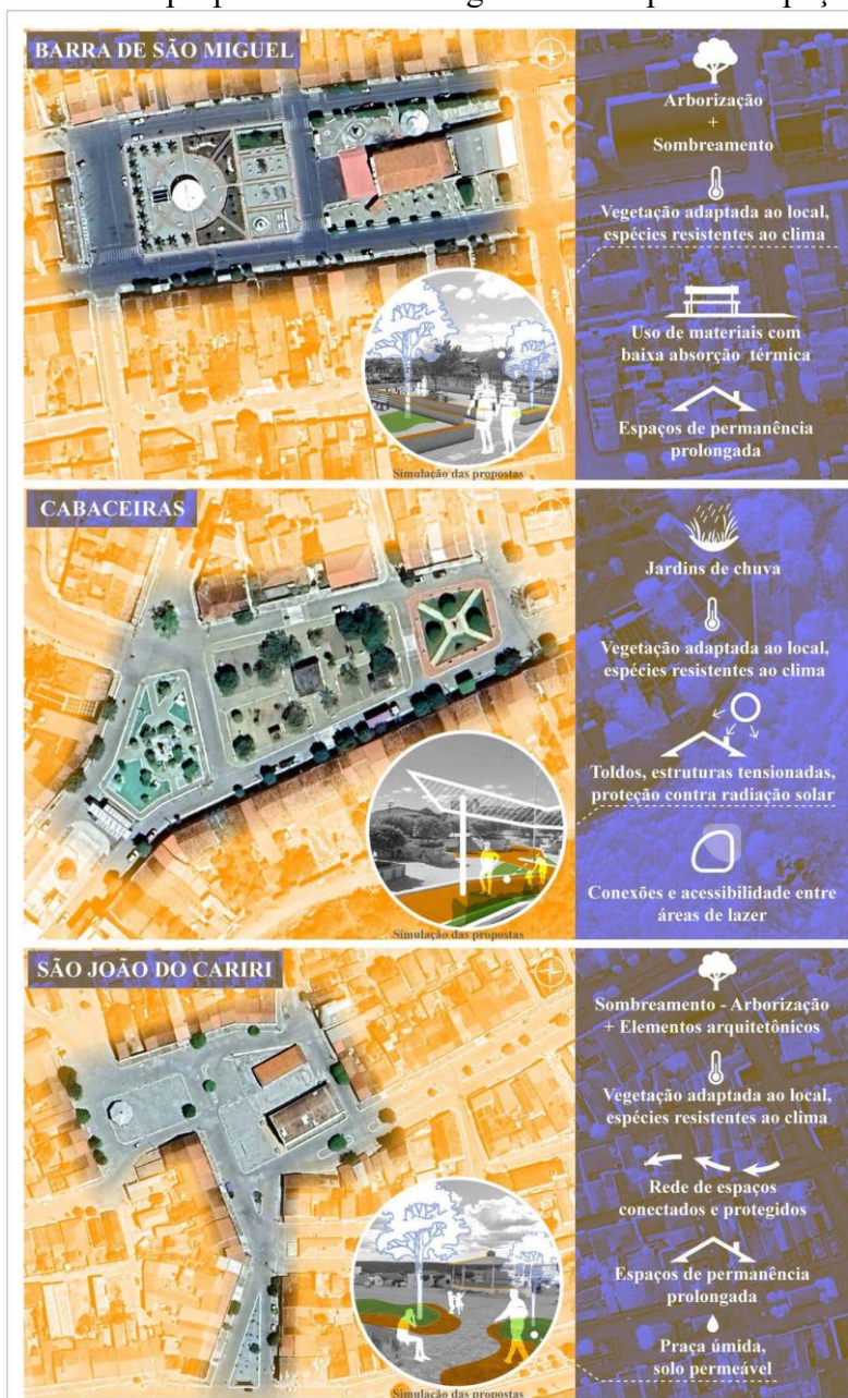
Figura 4 - Exercício propositivo de estratégias urbanas para os espaços públicos.

espelhos d'água nem elementos construtivos com a presença de água. Essa questão evidencia a baixa adoção de estratégias urbanas que integrem recursos hídricos aos espaços públicos — mesmo diante do cenário crítico de secas e estiagens — resultando em desempenho climático insatisfatório. Sendo assim, evidencia-se a necessidade de pensar em soluções adaptadas a cada realidade e contexto urbano (Figura 4).