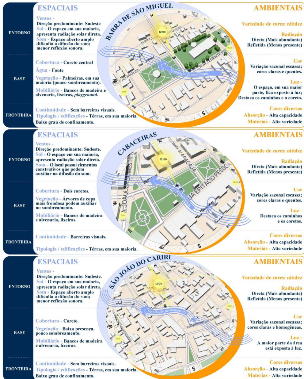
Figura 3 – Análise espacial e ambiental dos espaços públicos.