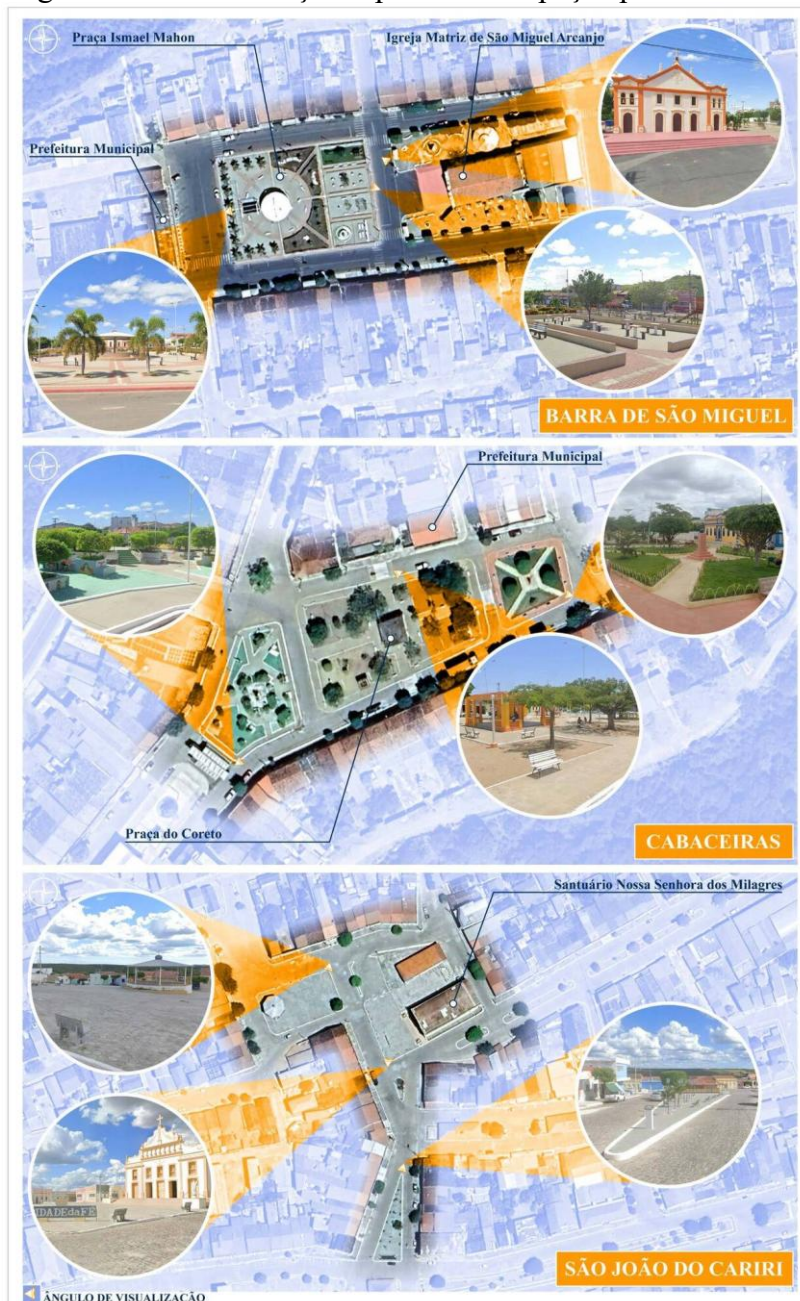
Figura 2 – Caracterização espacial dos espaços públicos.