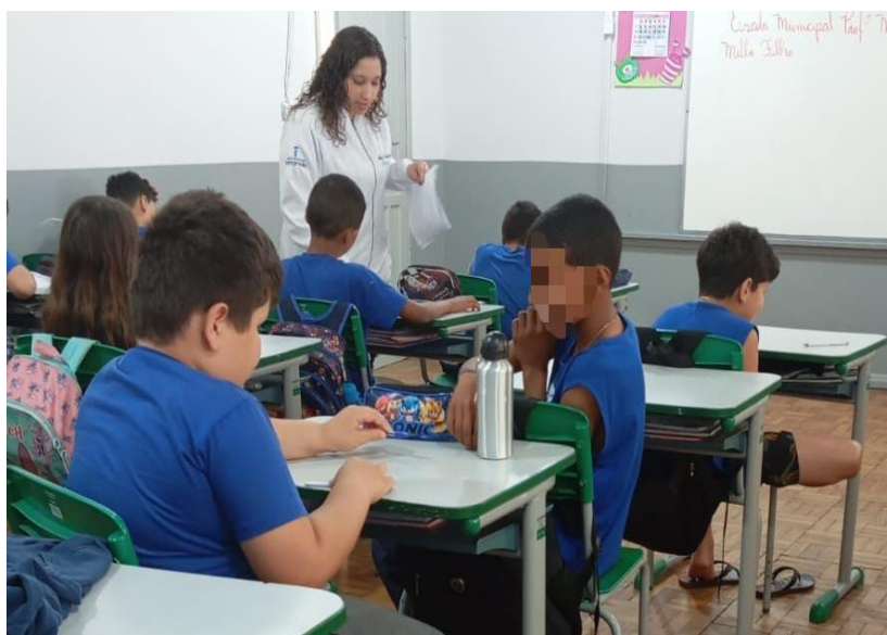
Figura 1 – Entrega dos formulários aos alunos

Posteriormente, dia 24 de setembro; os estudantes do 4º período de Biomedicina realizaram a primeira atividade em sala de aula, apresentando conteúdo educativo em slides, com linguagem acessível, explicando formas de transmissão das parasitoses e medidas preventivas. Também foram aplicados questionários adequados às faixas etárias, com registro dos dados pessoais, hábitos de higiene, saneamento e conhecimento prévio sobre parasitoses (Figura 1) (Neves et al., 2016; Centro Educacional Integrado, 2025).