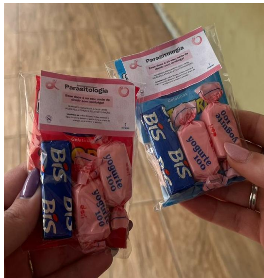
Figura 3 e 4 respectivamente – Entrega das lembrancinhas aos participantes.