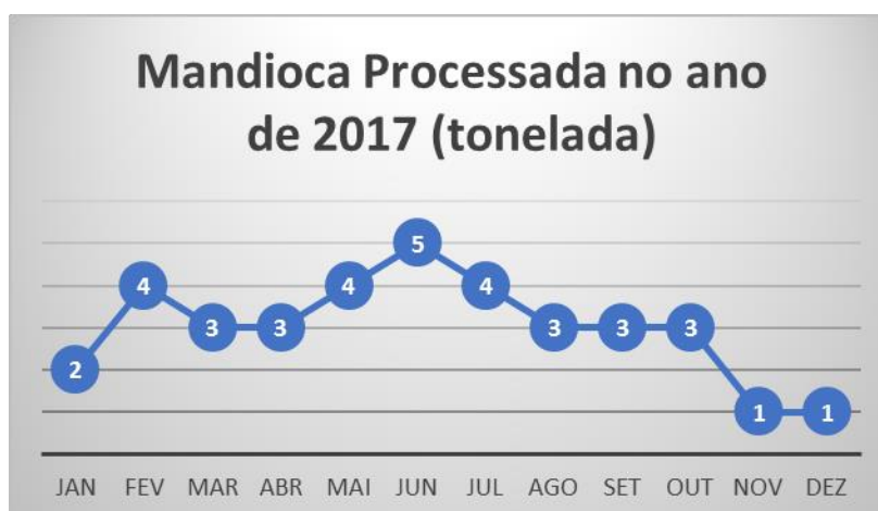
Figura 1- Mandioca Processada no ano de 2017

A Figura 1 apresenta a produção da mandioca processada no ano de 2017 na casa de farinha em Pacajus.