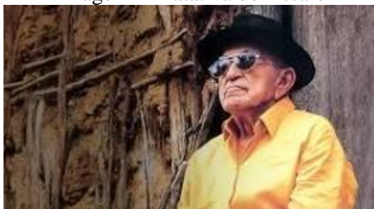
Imagem 2- Patativa do Assaré

Conhecido como o interprete do sertão, o poeta do povo Patativa do Assaré foi um grande nome da poesia brasileira e responsável por grandes sucessos de Luís Gonzaga. Em sua vida recebeu várias homenagens e premiações, além de ganhar o título de Doutor Honoris Causa da Universidade Regional do Cariri. Ele faleceu em 8 de julho de 2002, aos 93 anos, após uma parada cardíaca. O grande nome de Patativa é vivo em suas inúmeras produções.