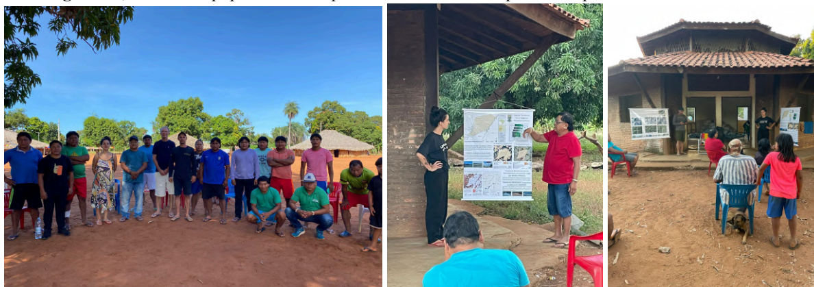
Figura 17, 18 e 19: Equipe da Unicamp e homens Xavante responsáveis pelo monitoramento da TI.

08 A 12 DE OUTUBRO DE 2025 | UFMS | TRÊS LAGOAS - MS