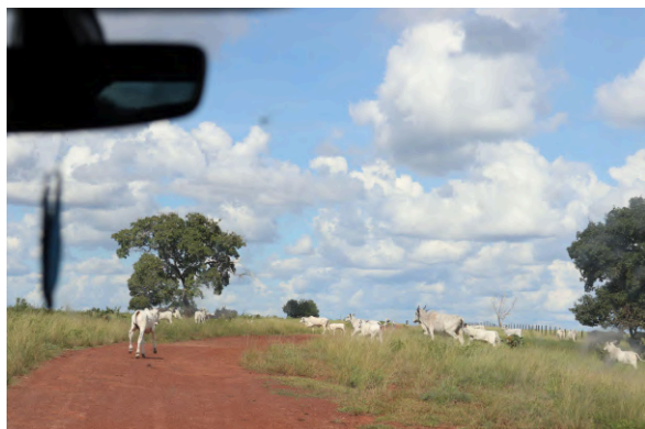
Figura 13: Imóvel rural de grande extensão destinado à criação de gado bovino. Margem esquerda do Rio Corixão, limite horizontal norte da TI Pimentel Barbosa. Figura 14: Remoção de vegetação recente em imóvel a norte da TI.

interpretações formuladas, levantou-se a possibilidade de os proprietários estarem delimitando um aceiro 13 , voltado ao impedimento do alastre de queimadas. Seria necessária melhor averiguação da condição presenciada. Apesar disso, o contraste novamente estava posto, agora com uma grande porção do bioma Cerrado preservado no interior do território Xavante, o que indica a eficiência do manejo indígena à manutenção da mata nativa. Esta, ao fundo, destoa do encontrado nas proximidades da cerca, e para além dela, no interior da fazenda em questão. Primeiro, uma área com aparente remoção da vegetação de alto porte e, depois, o monocultivo de soja, sendo este um exemplo do tipo de uso predominante nas externalidades da TI Pimentel Barbosa.