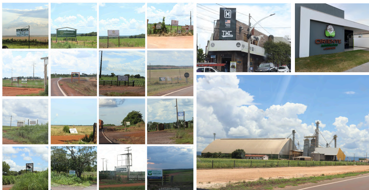
Figura 2: Mosaico de fazendas no entorno da TI Pimentel Barbosa. Figuras 3 e 4: Setor terciário em Barra do Garças (MT) e Canarana (MT). Figura 5: Armazém em trecho da BR-158.

observou-se a presença completa da sofisticada infraestrutura do agronegócio (armazéns, centros comerciais especializados, empresas de consultoria agrícola, etc.). As cidades no local, aparentemente, estão mais próximas das vias federais e estaduais, o que explica a concentração de estabelecimentos do setor terciário. Constituíram exemplos do cenário mato-grossense a ser defrontado no momento seguinte. Este, era composto pelos municípios que compreendem a TI e outros adjacentes, entre os quais Canarana, Ribeirão Cascalheira, Água Boa, Barra do Garças e Nova Xavantina, núcleos urbanos que integram as mesmas características, comportando uma rede de serviços especializada semelhante.