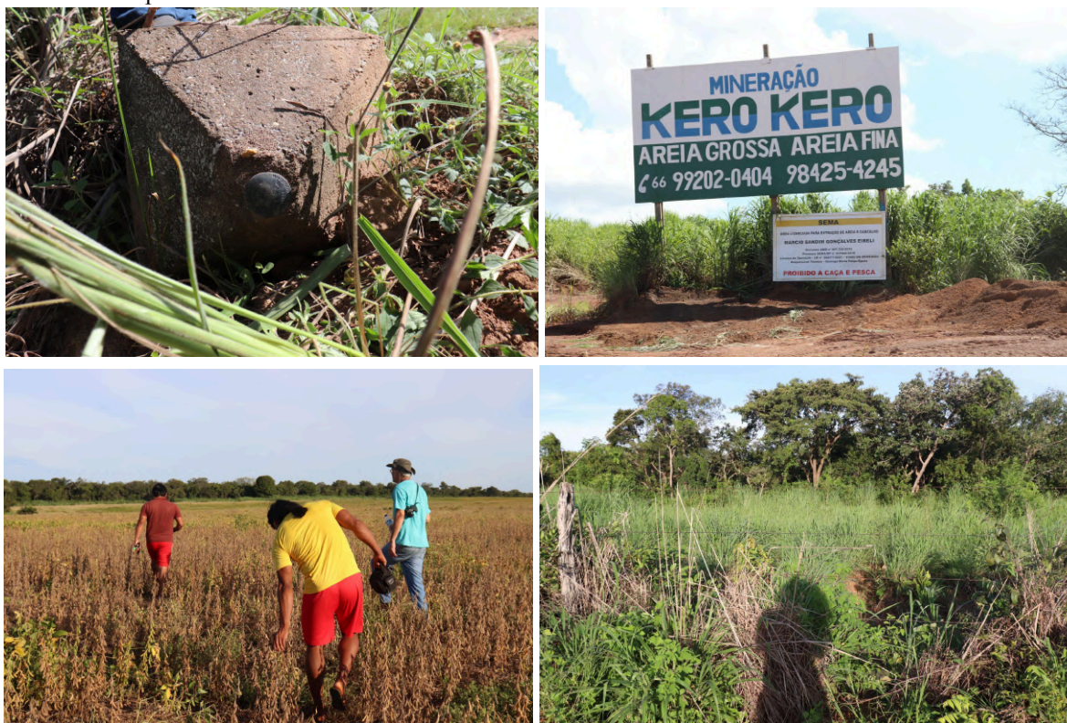
Figura 9: Marco físico da Funai. Figura 10: Área de exploração minerária, com registro do licenciamento concedido pela Secretaria do Meio Ambiente (SEMA). Figura 11: Monocultivo de soja na Fazenda Planalto. Figura 12: Cerca posicionada como limite físico entre a TI Pimentel Barbosa e a Fazenda Planalto.

traçado limite ou estariam expandindo sua área discretamente?”. Buscou-se, nesse sentido, percorrer o máximo de quilômetros possíveis do perímetro da TI. Saindo do vilarejo da Matinha, seguindo pela BR-158 até o Rio Água Suja, principal referência ao limite horizontal sul, estava o marco de demarcação da Funai, caído ao chão. Mais a norte da mesma BR, para além da pressão exercida pela agropecuária, encontra-se a mineradora Kero Kero, acusada de atividades irregulares, entre elas o descarte inadequado de rejeitos, que tem provocado o assoreamento dos cursos d'água mais próximos.