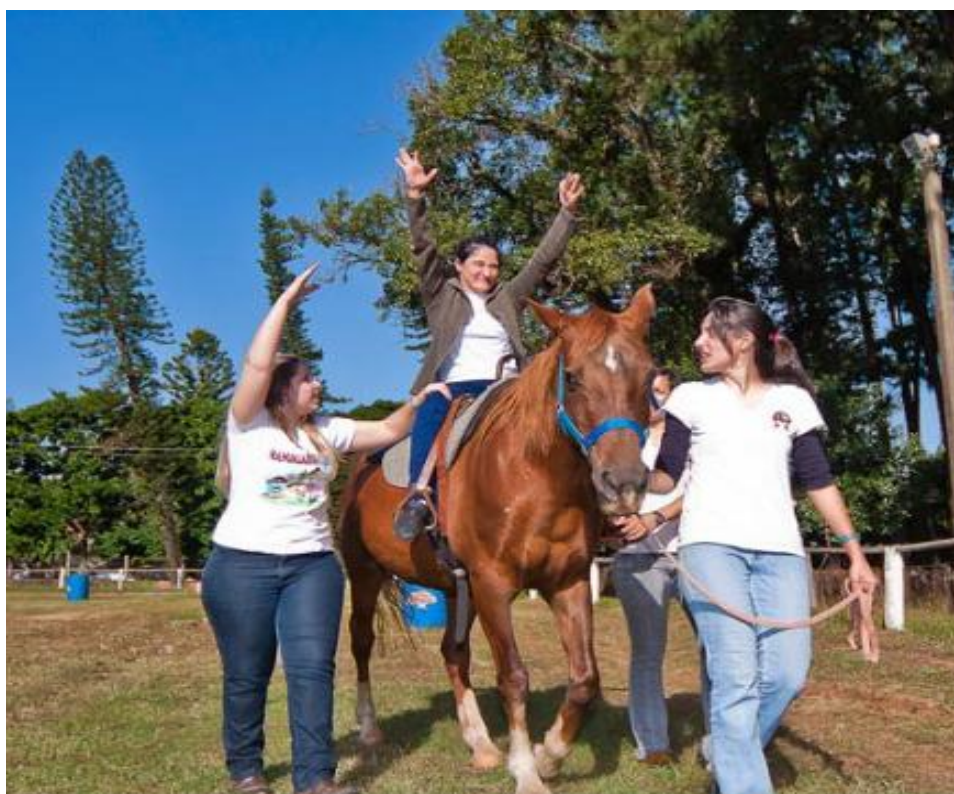
Figura 2: Atividade na Equoterapia