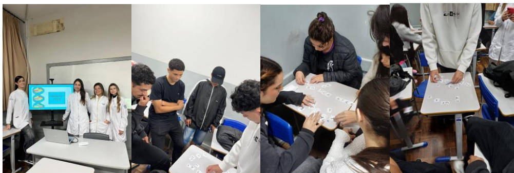
Figura 1A, 1B, 1C e 1D - Alunos realizando a montagem do quebra-cabeça aplicado na oficina.